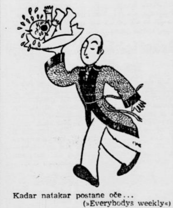
Kadar natakar postane oče... (Everybody's weekly)