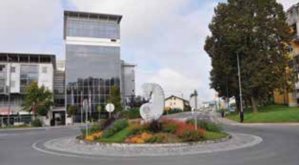
Krožišče pred občinsko hišo