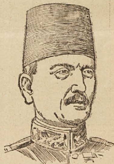
Umorjeni polkovnik Schlichting.