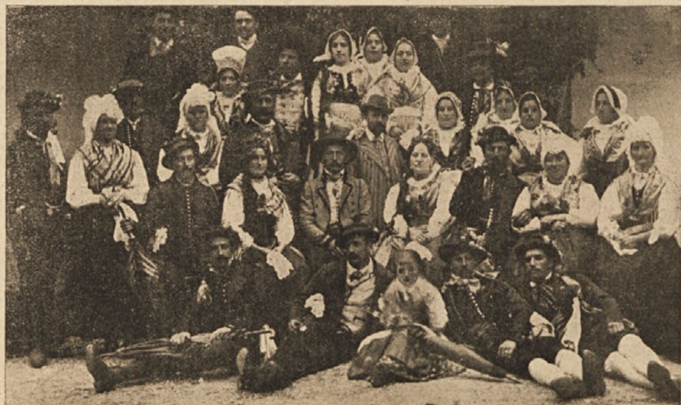
Kmečka svatba iz gornje Savske doline.

so jako slikovite in od vseh naših narodnih noš najbolj znane. Zbujale so opravičeno občudovanje že tudi izven naše ožje domovine.