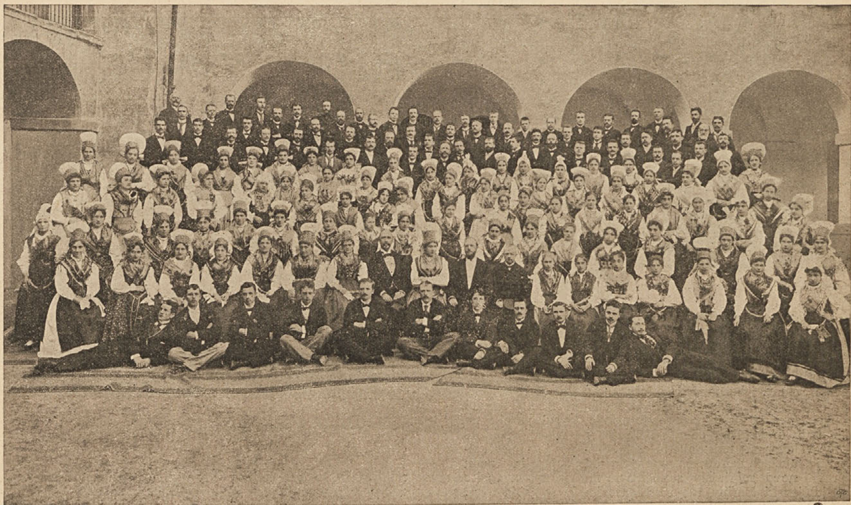
Pevski zbor „Glasbene Matice“ na Dunaju l. 1896.