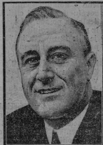
Novi ameriški predsednik Roosevelt.

Osnova občinskih financ je občinski proračun, ki ga je treba sestaviti za vsako leto naprej. Proračunsko leto se krije z državnim proračunskim letom. Občine smejo uvajati doklade na neposredne državne davke, uvesti pa tu-