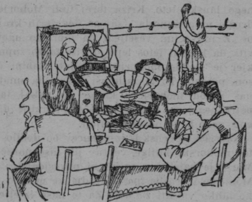
Kje je četriti igravec?