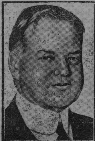
Prejšnji ameriški predsednik Hoover.

Vsak državljan kraljevine Jugoslavije mora imeti domovinsko pravico v kaki občini. Članstvo občine se izgubi samo, če dobi dotičnik domovinsko pra-