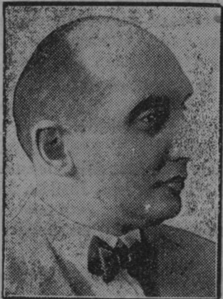
Poljski zunanji minister Zaleski, ki je po 7 letih odstopil.

Opasno je bil ustreljen od neznanca iz zasede v trebuh 25letni sodarski pomočnik Srečko Rojko iz Grajenščaka,