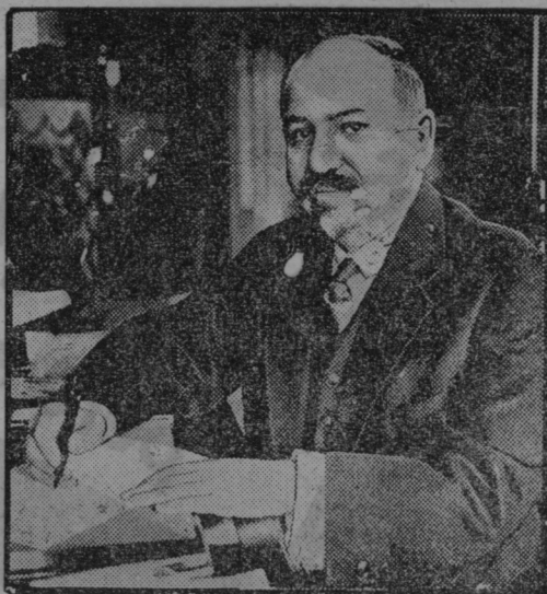
Novi sovjetski poslanik v Londonu — Maisky.

občina Vurberg pri Ptuj. Težko ranjenega so prepeljali v ptujsko bolnico.