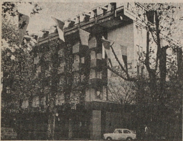
PH-PALACE HOTEL, Corso Italiana 63

34 170 Gorizia-Gorica, Italy; Tel.: 0481-82166; Telex 461154 PAL GO I