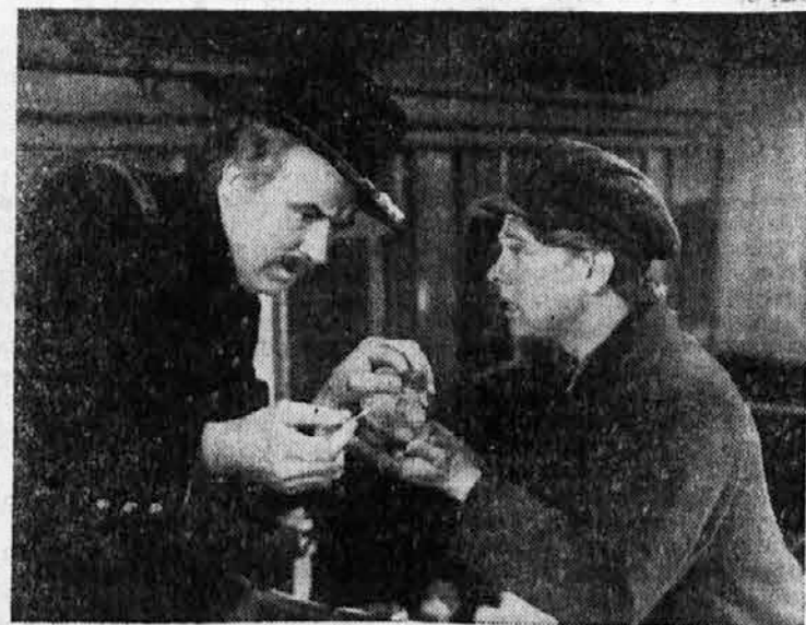
»Iz česa je to razstrelivo?« je spraševal kapitan Brackett