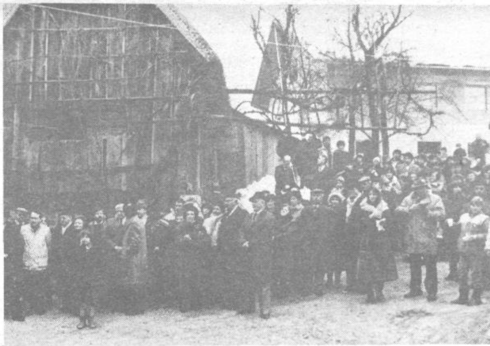
Takole izgleda obnovljena Stritarjeva kašča, ob kateri so se zbrali številni domačini in gostje.