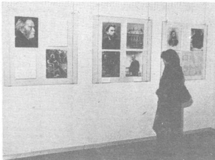
Laščani so se izjemno potrudili tako pri zbiranju arhivskega gradiva kot tudi pri ureditvi spominskih sob v Levstikovem domu. Obiskovalci se tako lahko seznanijo z delčkom kulturnega izročila v Stritarjevi in Levstikovi sobi.