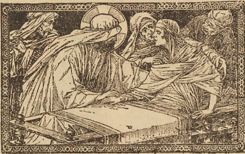
Mladenič, rečem ti, vstani!