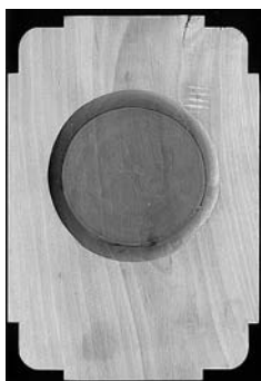
Izdelava zunanje oblike izdolbine

Naslednje štiri slike prikazujejo stopnje izdelave modela za loški kruhek. Modele je do posamezne stopnje izdelala oblikovalka in umetnica Petra Plestenjak iz Škofje Loke.