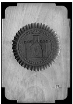
Globinsko izdelani relief