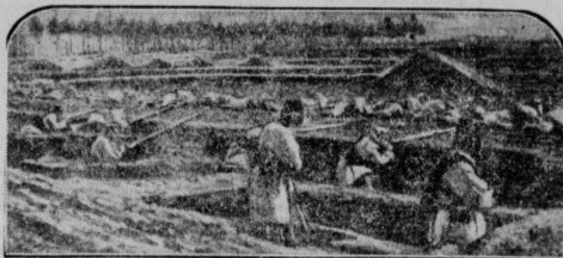
Cete kantonske vlade napadajo Hankau.

»Goold« in »Special« KVALITETNE ZNAMKE ZA KAKAO »VAN KASTER« 527