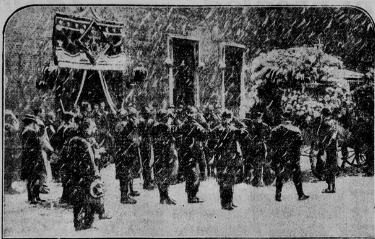
S pogrebu bivše mehikanske cesarice Charlotte izpred gradu Bouchout.