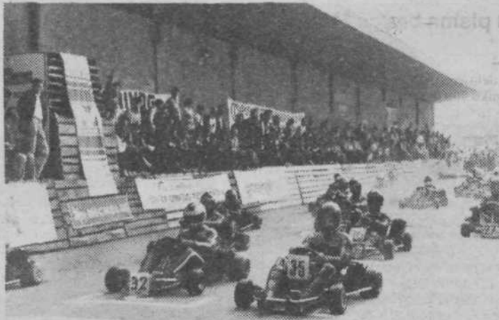
Start formule C/125 ccm za nagrado mesta Ljubljana