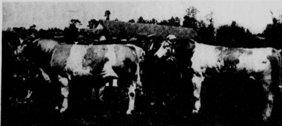
Najlepša domača bika, dveletna. Premovana v Turnišču dne 18. maja 1926.