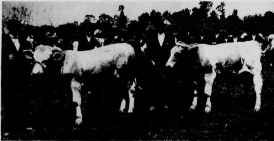
10 mesecev stara bikoa. Premovana v Turnišču dne 18. maja 1926.