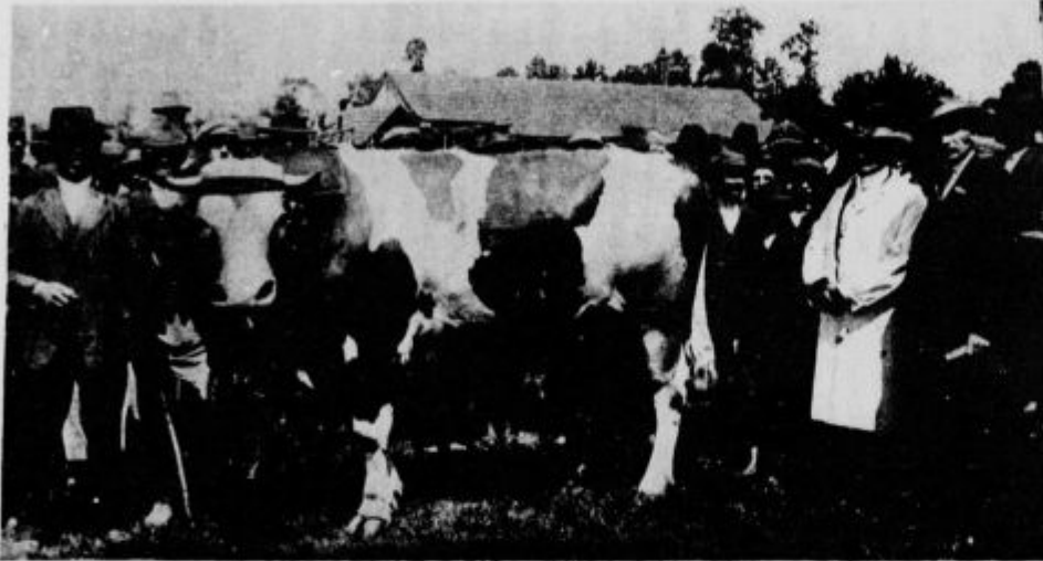
Uvoženi „Simodolec“ iz Švice, sedaj v občini Nedelici v Prekmurju. Premovan v Turnišču 18. maja 1926.

Ob koncu premovanja je veliki župan mariborske oblasti razdelil nagrade. Nato so strokovnjaki v kratkih pa temeljnih predavanjih kazali pot k uspešni živinoreji. Prireditelj, ki je bila prva te vrste v Prekmurju, je izpadla nad vse pričakovanje dobro.