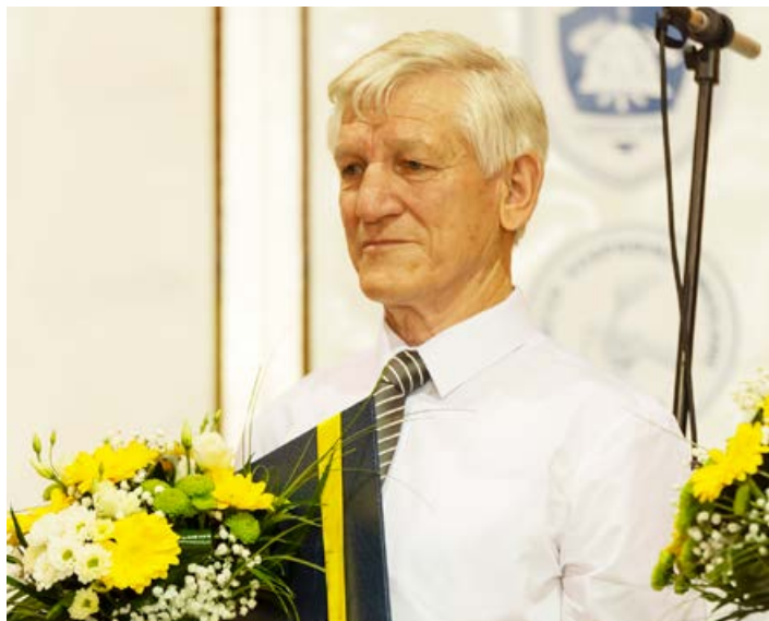
Priznanje tudi za Društvo upokojencev

PREDLAGATELJ: Kulturno društvo Cirkulane