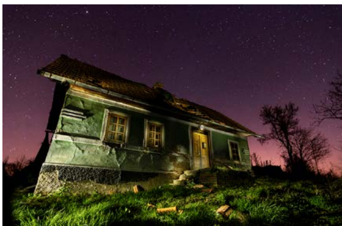
Ko pade noč

Bom rekel, da kar vse. Vse ima določen čar, še posebej narava. Zjutraj ali zvečer, vedno lahko opazimo kaj lepega. Morda pa so mi res najbolj pri srcu jutranje ali večerne