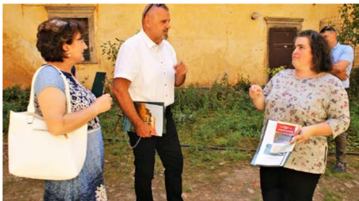
Predsednica društva je ministru predstavila pretekla prizadevanja.

Ogledal si je grajsko teraso, na kateri so arheologi izkopali najstarejši del gradu, in se zavzel, da se najdbe v največji možni meri ohranijo.