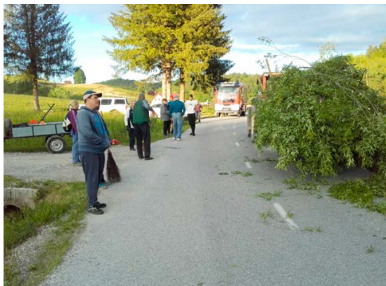
Kuluk.