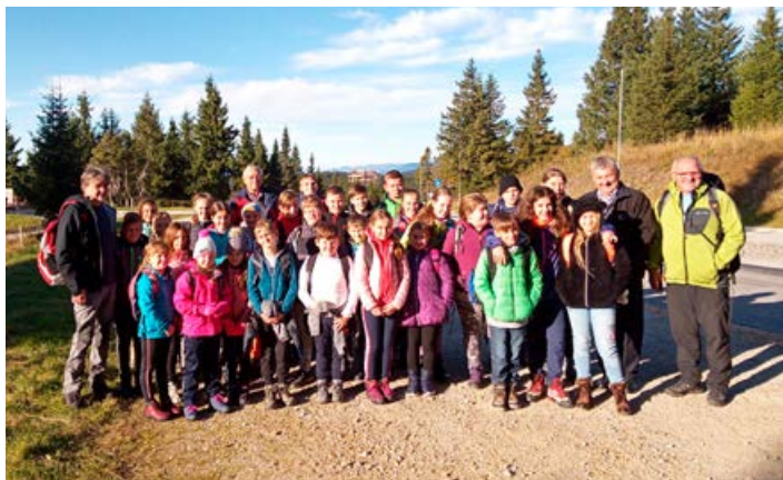
Mladi planinci med krošnjami.

V soboto, 12. 10. 2019, smo izpeljali jesenski planinski izlet mladih planincev in čebelarjev na Roglo. Natančneje, želeli smo si ogledati tamkajšnjo novo pridobitev, imenovano Sprehod med krošnjami. Spoznali pa smo tudi improvizirano pohorsko vasico in jo mahnili po gozdnem kolovozu na Pesek.