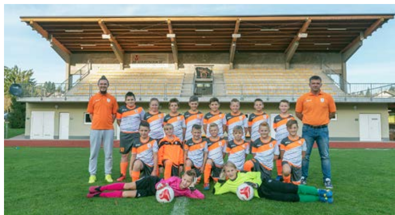
Nogometni podmladek v Cirkulanah.