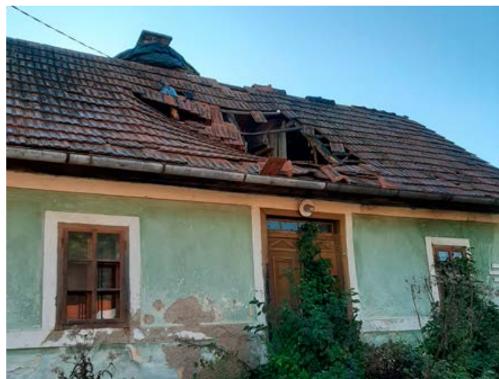
Streha pred prekrivanjem.

Izvršni odbor Turističnega društva Cirkulane je na svoji seji sklenil, da objekt malo bolje zaščitimo, kajti prihajajoča