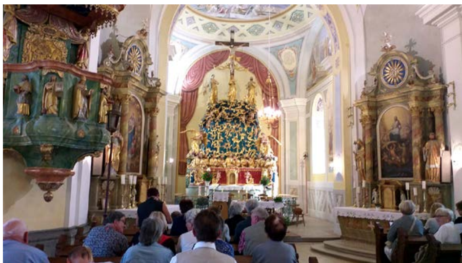
Praznično okrašen oltar v župniji sv. Barbare.