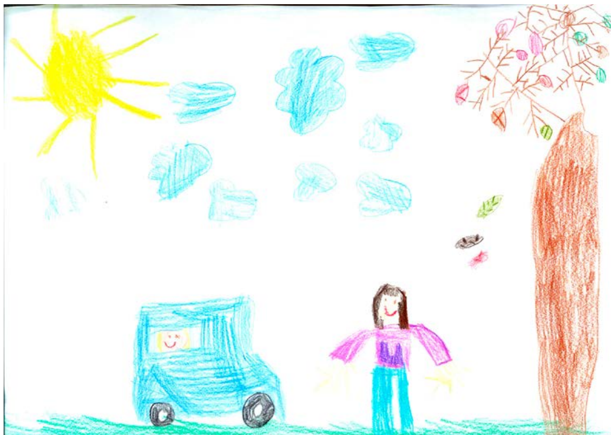
Eva Gašperič, 1. a