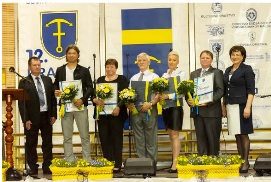
Prejemniki priznanj skupaj z županjo in

Do 16. junija se je (v okviru praznika) zvrstilo še veliko prireditev. PGD Cirkulane je 8. junija izvedla slavnostno predajo gasilskega avtomobila. Sledili so še razni turnirji (ribolov, nogomet itd.) v izvedbi Športnega društva Cirkulane, ki so privabili veliko športnih navdušencev, dejaven pa je bil tudi