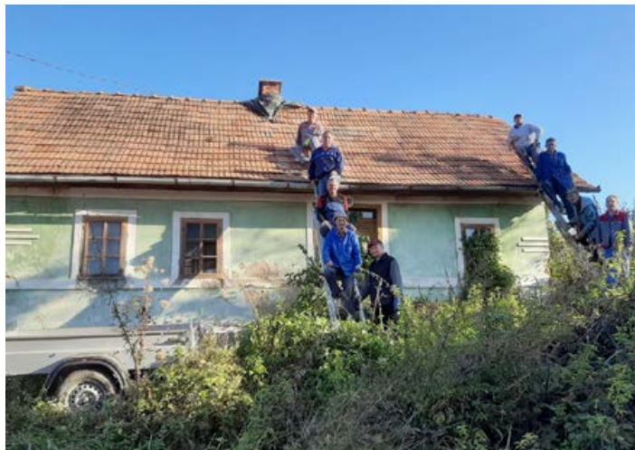
Med delovno akcijo.

zime ne bi preživel. K akciji smo povabili še Vaški odbor Mali Okič-Slatina in v sončni soboti družno popravili ostrešje, pripeljali opeko in vse skupaj pokrili. Načrtujemo še ureditev okolice in čiščenje notranjosti. Tako lahko objekt čaka še naslednjo zimo, da se dogovorimo, kaj bomo iz objekta naredili.