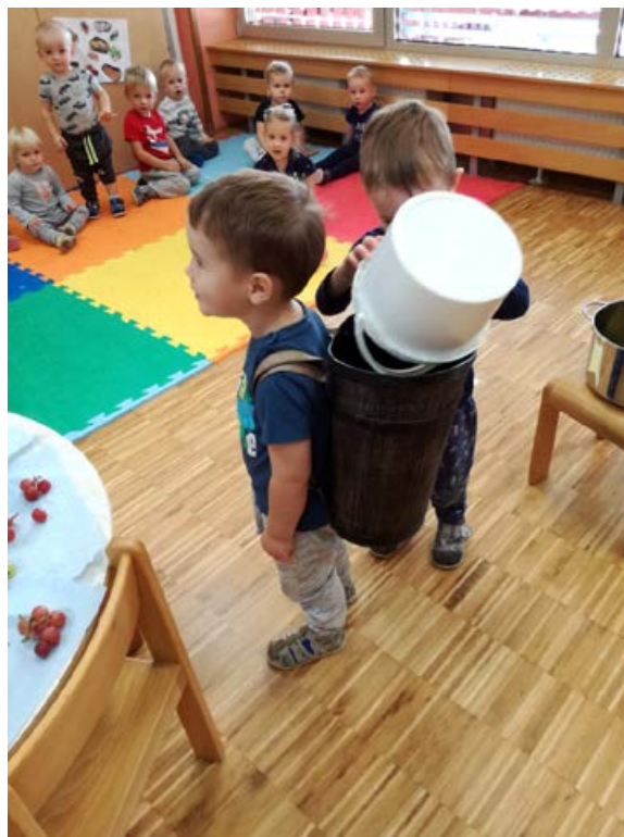
Trgatve v vrtcu.

Pogumno, razgibano in hudomušno. V mesecih, ki prihajajo, se bomo srečali s številnimi zunanjimi izvajalci, ki bodo