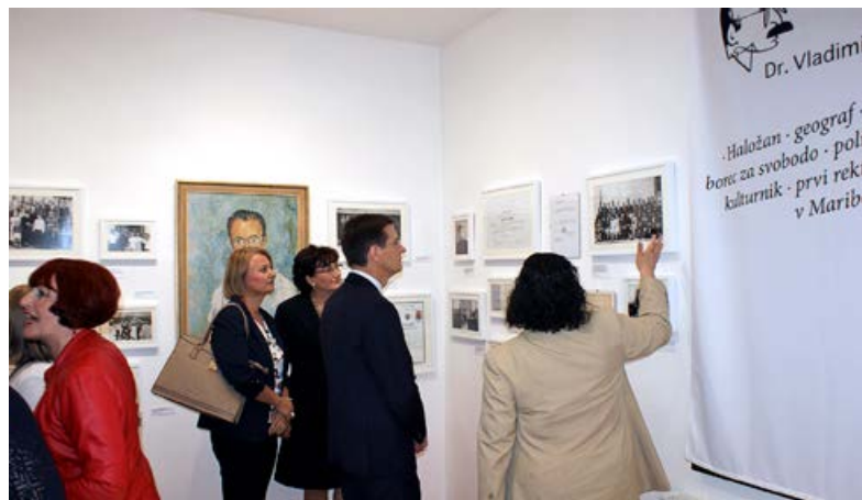
Spominsko sobo si je ogledal tudi rektor mariborske univerze.