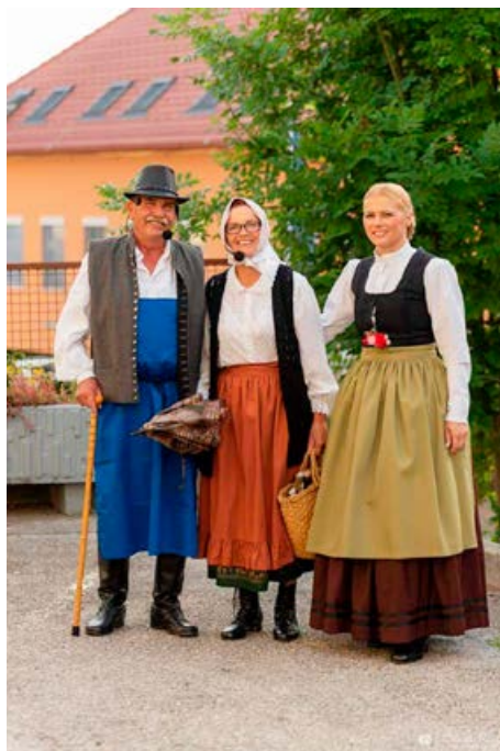
Kultura nam riše smeh na obraz.

Letošnje leto je bilo v našem kulturnem društvu res pestro in aktivno. Še enkrat hvala vsem članom društva in vsem, ki ste nam s svojo dobro voljo ter prispevkom pomagali do uresničitve naše poti. S svojim delovanjem ste resnično pripomogli k odličnemu zaključku leta. In ko sedaj razmišljam za nazaj, ugotavljam, da od vas nikoli nisem slišala besed ne morem ali nima časa. In to zelo cenim. Znamo biti slo-