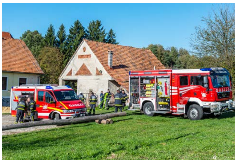
Vedno v akciji.

Že 23. 10. 2019 ob 10.30 uri smo v sodelovanju z OŠ Cir-