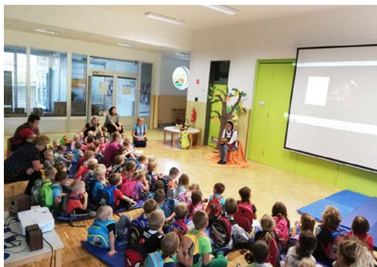
Pohod s knjigo in kino v vrtcu

Meseca oktobra praznujejo otroci. Takrat smo v sklopu izvajanja »Teden otroka« izvedli številne dejavnosti, ki še