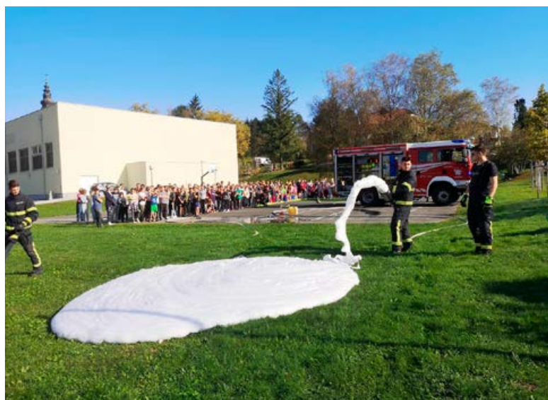
Prikaz gašenja z peno ob evakuaciji šole.