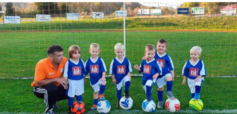
Dopoldan v vrtcu, popoldan na vareški zelenici.

igralki, selekcijo U6 pa sestavlja 6 malih mojstrov okroglega usnja. Ekipo vodi Damjan Kokol.