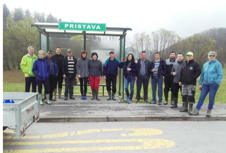
Čistilna akcija.

Leto 2019 je bilo prav gotovo zelo delovno v našem vaškem odboru (VO) Pristava. Odbor šteje devet članov, kateri smo se zbrali na treh sestankih vaške skupnosti. Vse sestanke smo imeli na Turistični kmetiji Kozarčan pri Francu Roškarju. Meseca marca in aprila smo člani vaške skupnosti naredili zelo podroben obhod našega kraja ter na osnovi videnega naredili načrt dela, katerega smo kasneje posredovali na občino. Poudarek smo dali na vodotoke, odbojne ograje, gramoziranje posameznih odsekov, udrnin na asfaltnih površinah, zamuljenost obcestnih jarkov, odvodnjavanje ter košnji. Z veseljem lahko rečemo, da je veliko že bilo