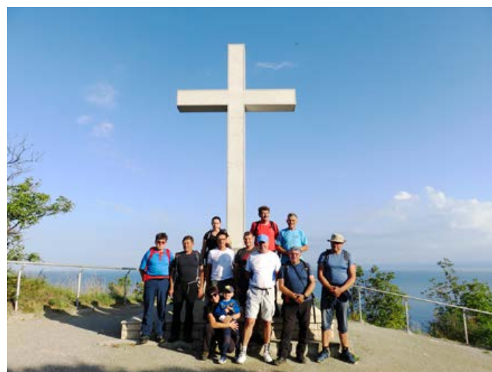
Cirkulanski planinci na Primorskem.

Pot smo nadaljevali proti Vipavi in v Podgorju štartali po