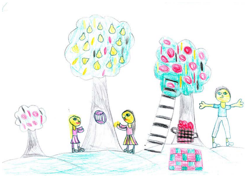
Gal Fridauer, 2. a