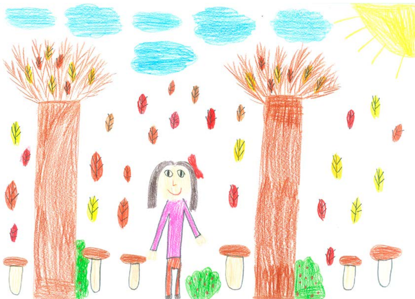
Isabella Ban, 2. a