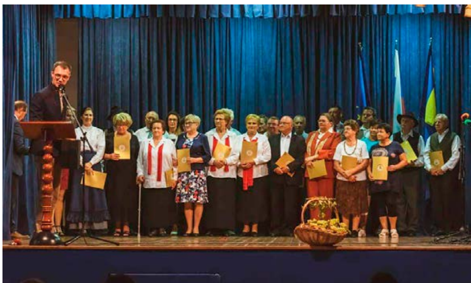
120 let KD Cirkulane.