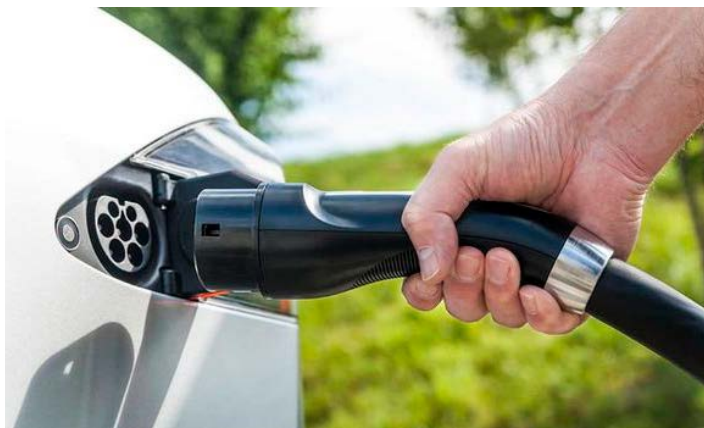
Fotografija je simbolična.

cij, zato se rednim uporabnikom polnilnic za električna vozila priporoča registracijo.