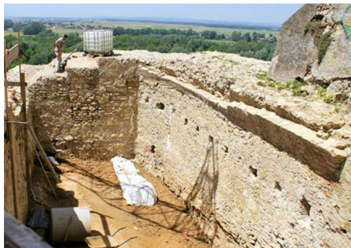
Med sanacijskimi procesi so odkrili tudi arheološke najdbe.

Ko so odkopali zasuto pritličje nekdanjega romanskega grajskega palacija iz 13. stoletja, ki je bil prvotni grajski bivalni objekt, so spodaj odkrili še starejše zidovje, ki je najverjetneje stalo že v 11. stoletju, morda pa še prej.