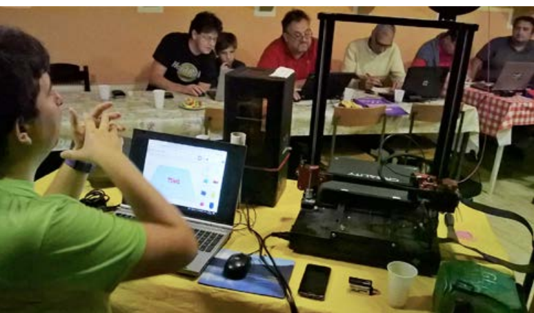
Prosta mesta za delavnico 3D tiskanja so se hitro zapolnila.

V mesecu oktobru smo v prostorih Radiokluba Cirkulane organizirali brezplačno delavnico za uporabo 3D-tiskalnic