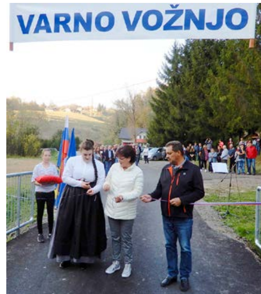
Odprtje ceste v Gruškovcu.

zahvala tudi našim krajanom, ker so prispevali rujno kapljico, slastno pecivo, hvala da ste si vzeli čas da smo skupaj pripravili in vrnili lovski dom v stanje kot smo ga prejeli. Hvala za prejete čestitke, nasmeh in stisk rok, saj je to vodilo, ki te žene, da se je vredno truditi. Hvala, da sodelujemo in korakamo skupaj. Naj vam bo vsaka pot, prehojena ali prevožena varna in srečna.