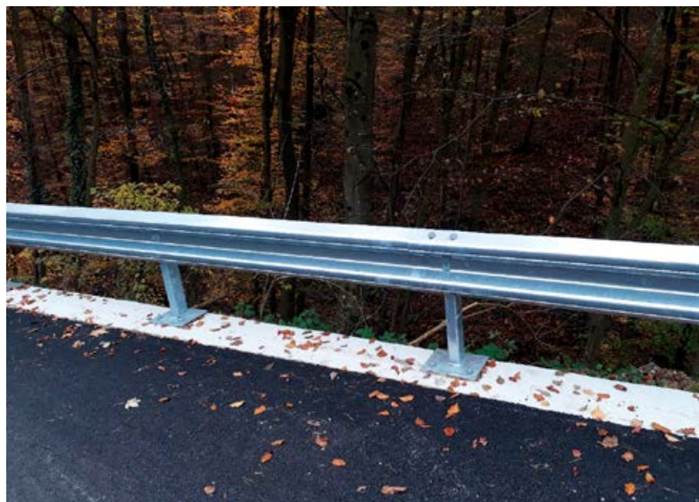
V mesecu novembru se je na večih odsekih cest izvedla postavitve jeklenih varnostnih ograj v skupni dolžini 536 m.

Občina Cirkulane je na portalu javnih naročil, dne 19. 9. 2019, objavila obvestilo o javnem razpisu za oddajo javnega naročila male vrednosti. Na povabilo so prispele tri ponudbe. Kot najugodnejši ponudnik je bilo izbrano podjetje ASFALTI Ptuj, d. o. o., (za sklop 1, torej za cesto) in GEODRILL, d. o. o., (za sklop 2, za stabilizacijo brežine).