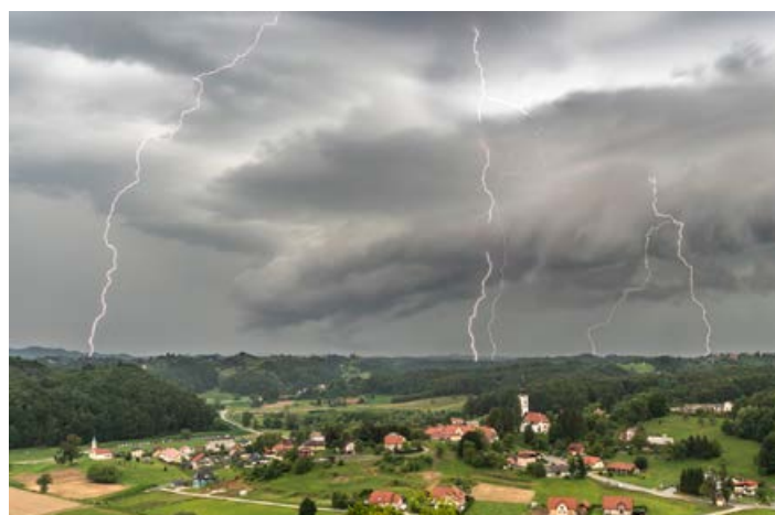
Nevihta nad Varežem

Včasih si naredim cel načrt in si izberem ali lokacijo ali določen motiv, najraje kakšno starejšo hiško v Halozah. Potem spremljam vreme, čas sončnega zahoda, nastanek neurij in kam se premikajo. Pri nočnih fotografijah je pomembno