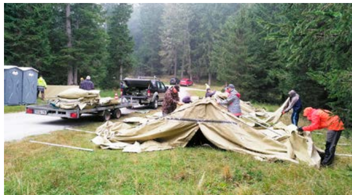
22. Evropsko prvenstvo Lov na lisico.

Člani Radiokluba Cirkulane smo skupaj z radioamaterji iz Ptujске Gore in Ormoža prevzeli nalogo postavitve šotorov, ki so služili za opravila tekmovalcev na startu in cilju. Tako smo se iz Cirkulan v času prvenstva štiri kart odpravili v smeri Rogle na Pohorju in postavili - prestavili šotore, saj so ob različnih disciplinah bile različne lokacije. Ob koncu prvenstva smo šotore naložili na transport do regijskega gasilskega vadbenega centra v Ormožu tam smo jih očistili in so bili predani nazaj v Upravo za zaščito in reševanje na Ptuj.