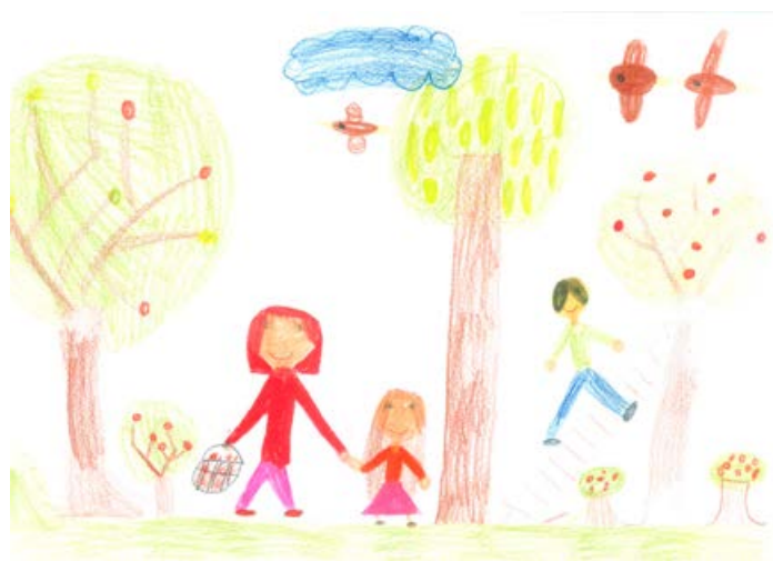
Aljaž Zavec, 2. a