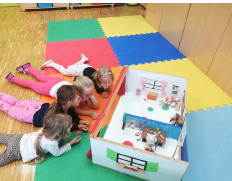
Na obisku pri mucih Copatarici.

Poletne radosti in brezskrbno poležavanje nekje pod domačo senco je samo še bežen spomin. Danes, ko se vam oglašamo, sta za nami že dobra dva meseca spoznavanja, učenja in raziskovanja. In če je morebiti nekdo pomislil, da življenje v vrtcu poteka počasi, z majhnimi koraki, lahko tokrat potrdim, da smo pričeli s polno mero ustvarjanja, raziskovanja in učenja z dvignjeno glavo. Najprej mi dovolite, da se seveda v našem članku zahvalim Občini Cirkulane, ki je tekom poletnih počitnic poskrbela za novo, še boljše in varnejše okolje za naše malčke in vzgojitelje. Meseca avgusta so se v vrtcu izvajala številna vzdrževalna dela, ki so kar klicala po prenovi. Z novim šolskim letom smo tako pridobili novo vodovodno napeljavo, uredili vrtčevsko kuhinjo in keramiko, prepleskali hodnike in avlo vrtca ter se s skupnimi moči podali v čiščenje in razkuževanje vsakega posameznega prostora. Ko so naši prostori dokončno »zacveteli«, smo vrata vrtca odprli za 63 otrok. Seveda se tekom šolskega leta ne bomo ustavili pri tej številki, saj se nam bodo vse tja do meseca januarja vključevali novinci, s katerimi bomo poskrbeli, da bodo vse skupine našega vrtca ponovno polno zasedene.