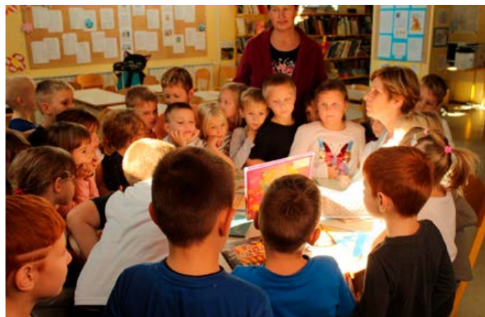
Utrip šolske knjižnice.

Tudi vas, dragi starši, vabimo, da tudi v naslednjih mese-