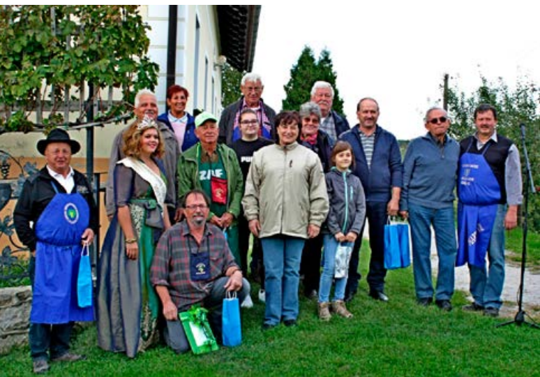
Trgatev Modre Kavčine 2019, na fotografiji so vinogradniki, ki so prinesli svoje grozde Modre kavčine na tehtanje.

skega vrha, Občina Videm, za renški rizling 2018 z oceno 18,37. Šampiona med polsladkimi in sladkimi vini je dobil Mitja Golob iz Zagojčev, Občina Gorišnica, za laški rizling, suhi jagodni izbor 2017 z oceno 19,50.