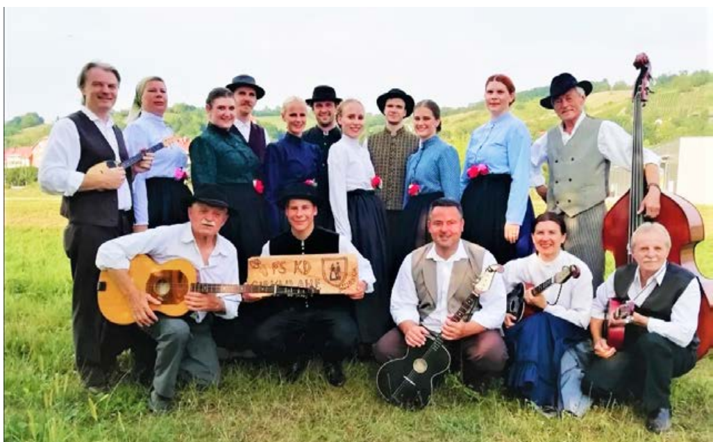
Folkloristi in tamburaši iz Cirkulan.

Tukaj pa se nastopi ne končajo, saj smo nastopali nekajkrat tudi kot presenečenje večera in polepšali rojstne dni, zaplesali na srečanju ljudskih pev-