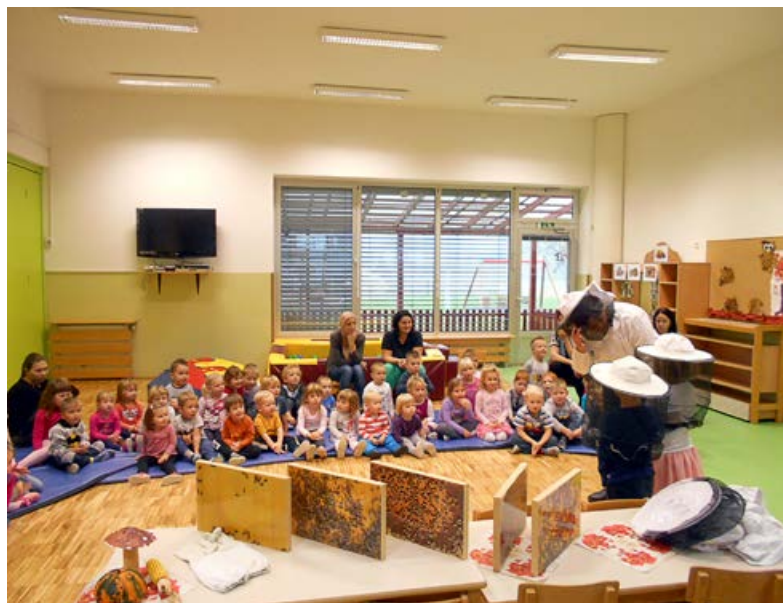
Medeni zajtrk v vrtcu.

Čebele se počasi pripravljajo na zimski počitek, mi pa nadaljujemo z ostalimi dejavnostmi (razna popravila, nove