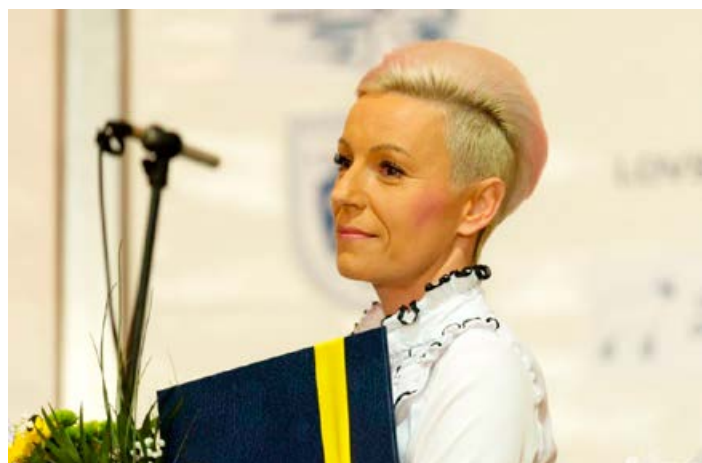
Predsednica KD Cirkulane.

PREDLAGATELJI: Društvo za oživitev gradu Borl, Društvo vinogradnikov in sadjarje Haloze, Turistično društvo Cirkulane.