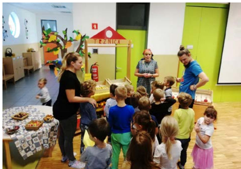
Tržnica v vrtcu.

In če smo meseca septembra vse prilagodili igri otrok, smo tudi oktobra nadaljevali v tem ritmu. Že v samem začetku meseca smo pričeli z izvajanjem projekta »Trajno-