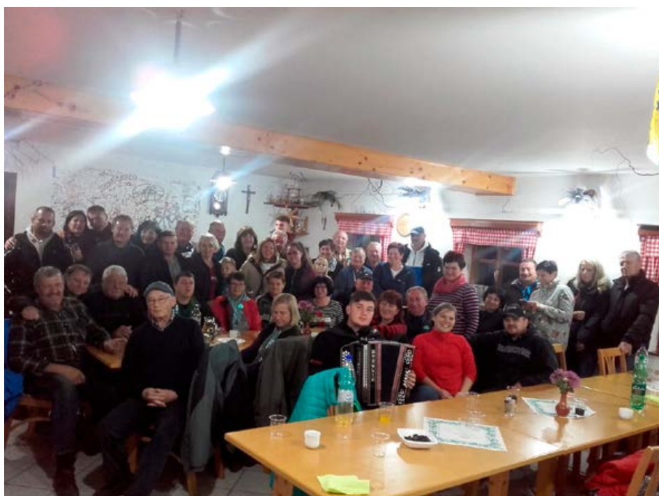
Srečanje krajanov.

Za prijetno druženje Pristavčanov pa smo poskrbeli na že tradicionalnem srečanju vseh vaščanov Pristave, ki ga