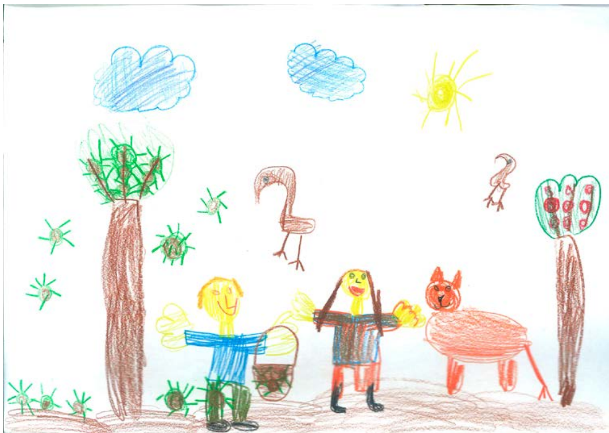
Tinkara Horvat, 1. a