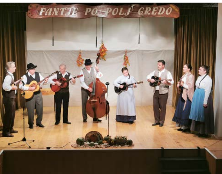
Nastop v Račni pri Grosupljem z novima članicama.