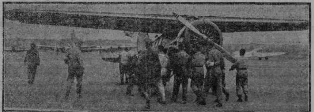
Amerikanska letalca Mattern in Griffin po preletu Atlantskega Oceana v 19 urah na letališču v Berlinu. Letalcema se je pokvarilo letalo ob rusko-poljski meji in se jima je izjalovil polet okrog sveta.

Neznana žrtev na železniški progi. Dne 12. julija zvečer je povozila lokomotiva iz Čakovca blizu postaje Središče neznanca in ga tako razmesarila, da sta ležali roka in noga proč od trupla. Povoženi je star kakih 30 let, v delavski obleki in ima na levi roki utetovirani črki I. P. in letnico 1901—1921-22. Še ni dognano, ali gre v tem slučaju za samomor ali za nesrečo. Kedo je povoženi nesrečnež, so dognali. Gre za po-