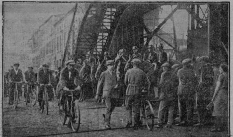
Stavka v Belgiji. Orožniki ščitijo javna poslopja.