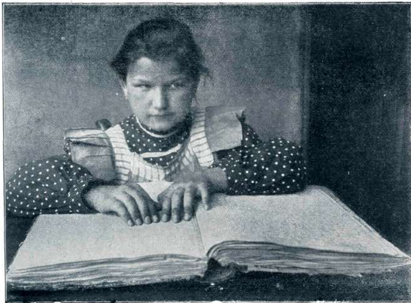
KAKO SLEPCI ČITAJO.