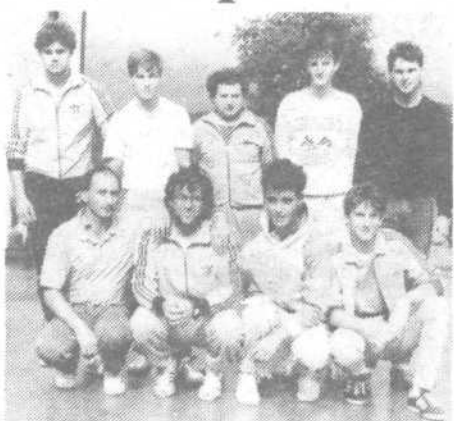
Na turnirju v malem nogometu se je najbolje odrezala moštvo »Jama Berda« iz Podpeči-Preseje