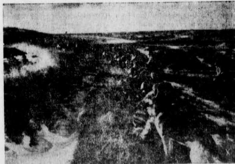
Grabenkampf auf dem chinesischen Kriegsschauplatz: Die Meldehunde erhalten beim japanischen Militär eine sehr gründliche Ausbildung und nehmen an den Gefechten teil

dratkilometer Bodens abgetreten habe. Auf dem überaus fruchtbaren Boden, der an Siam abgetreten wurde, befinden sich Plantagen, die jährlich 250.000 Tonnen Reis, 100.000 Tonnen Mais sowie große Mengen an Pfeffer und Kautschuk liefern.