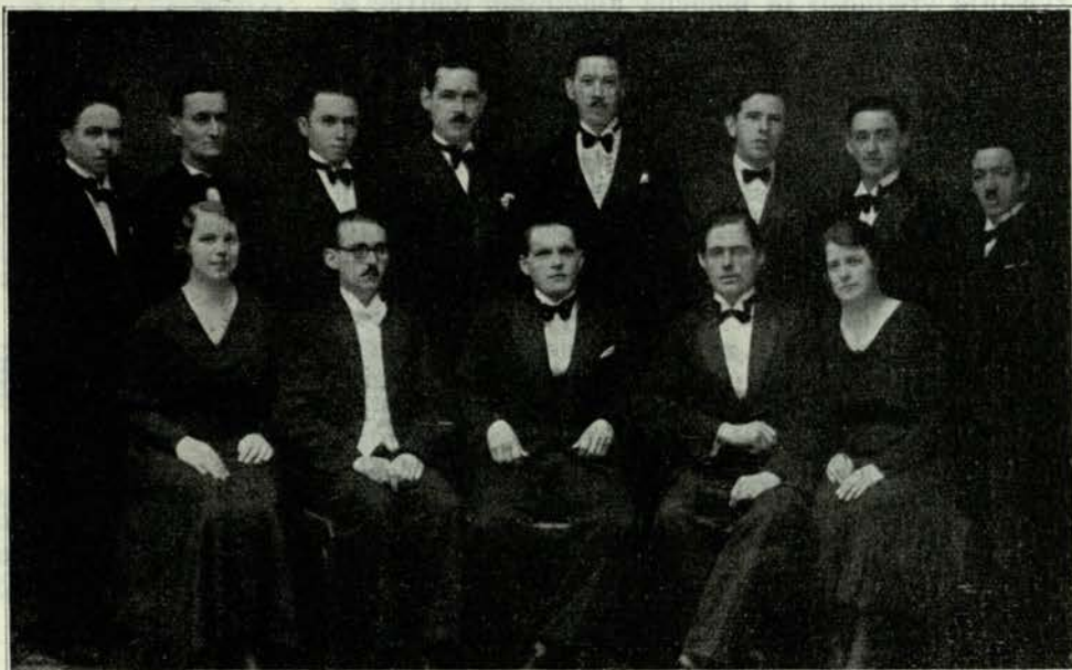
Odbor pevskega društva «Slavca».