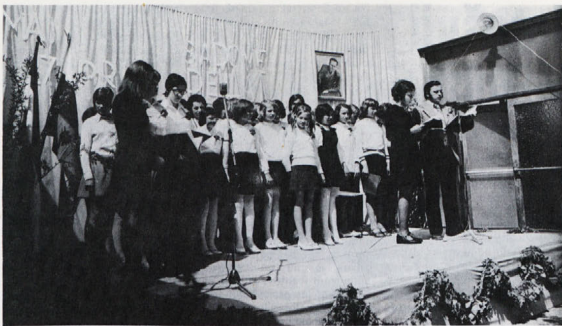
Na proslavi v počastitev 1. maja je novoustanovljena kulturna skupina izvedla s pomočjo učencev stopiške šole svoj prvi program. Organizatorjem velja vse priznanje.