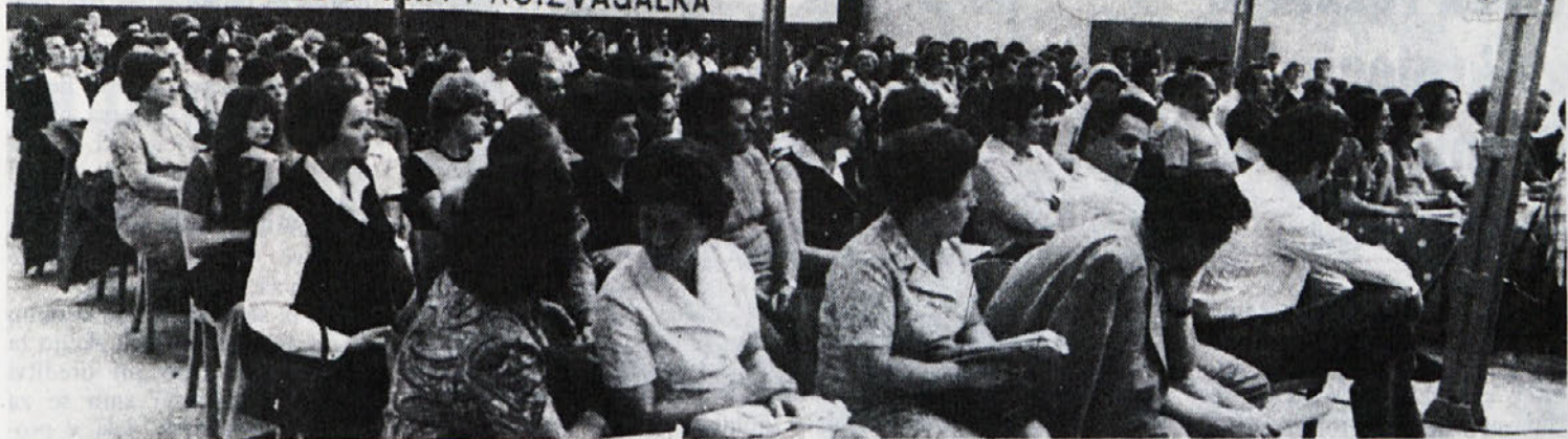
Pogled na udeležence tribune: besedo ima proizvajalka, ki je bila 20. maja v Tekstilni tovarni Maribor.