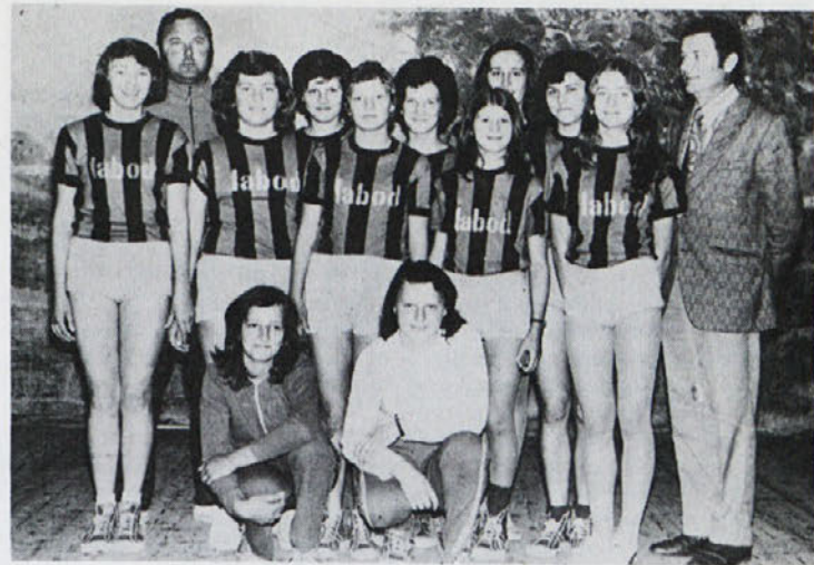
Veseli obrazi stopiških pionirk s svojima „mentorjema“ po velikem uspehu.