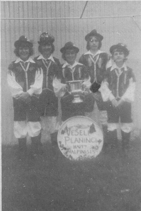
"Veseli Planinci" z zasluženjo nagrado.