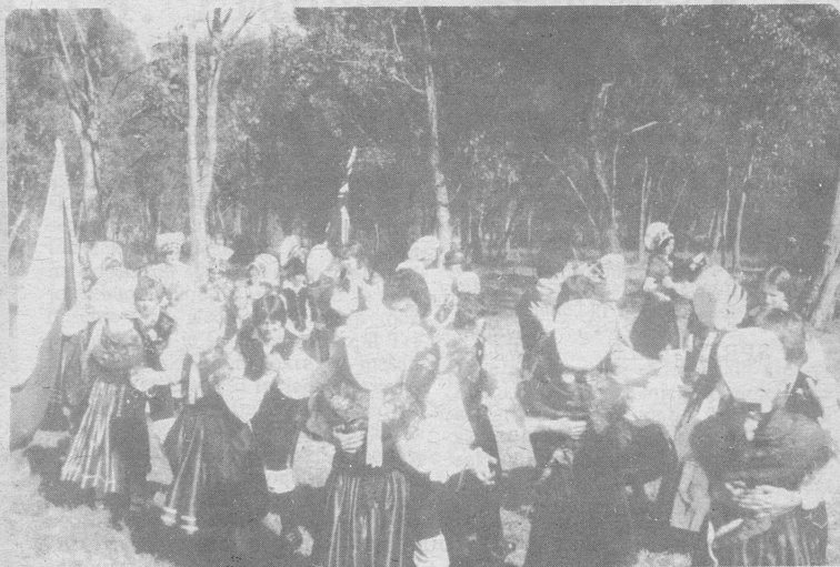
Mladina S.D.M. in "Planice" na elthamskem hribočku ob snemanju za nastop, ki bo 29. aprila 1978, v korist Caulfield Hospital Appeal.