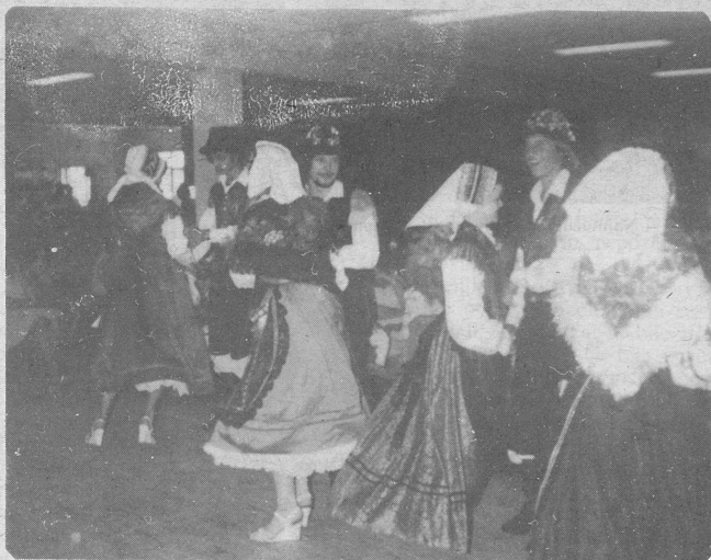
Nastop mladinske folklorne skupine ob odkritju spomenika Dr. F. Prešernu v prostorih S.D. Sydney.