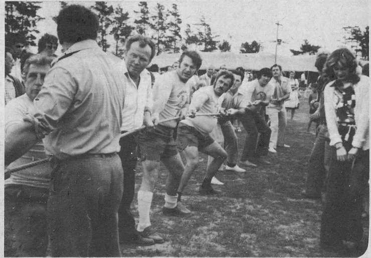
Najmočnejša je bila moška ekipa S.D. Planice