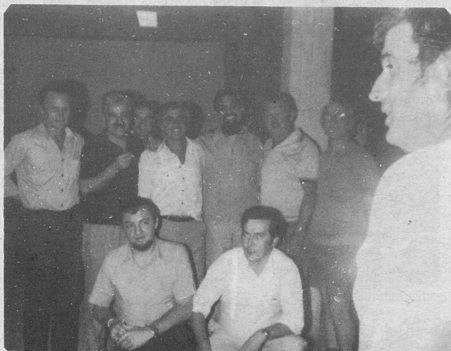
Gospoda Seliger in Zlobec s člani in odborniki S.D.S.