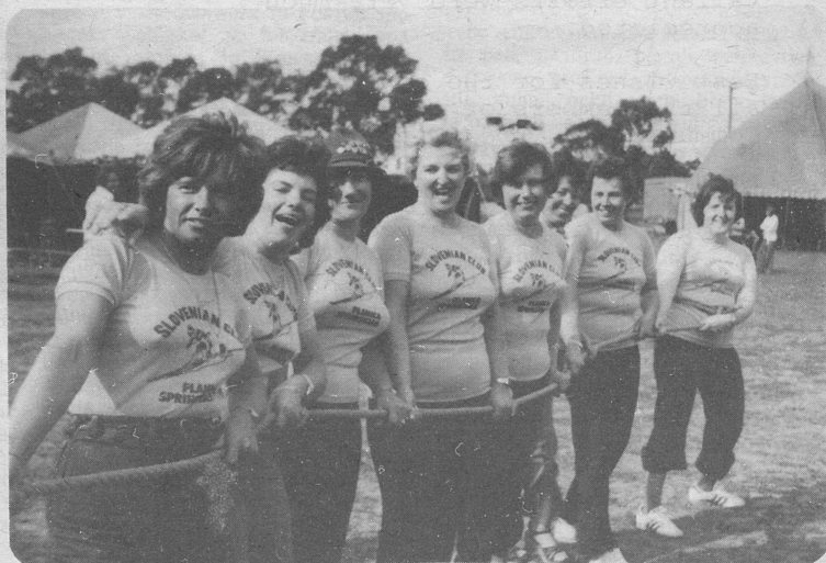
Zenska ekipa S.D. Planice je bila tudi najmočnejša — ob proslavljanju "Australia Day" v Dandenongu 20. jan. 1978.