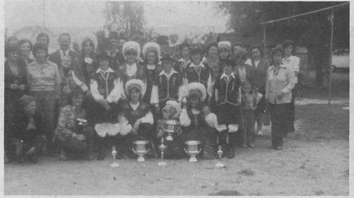
Šest pokalov so "Planičarji" pridobili v enem "weekendu".