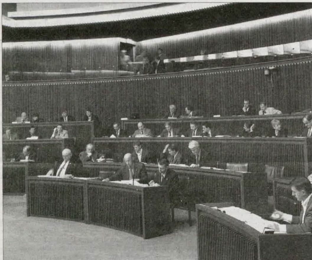
Il consiglio regionale uscente durante una seduta

Le consultazioni elettorali del 13 e 14 aprile