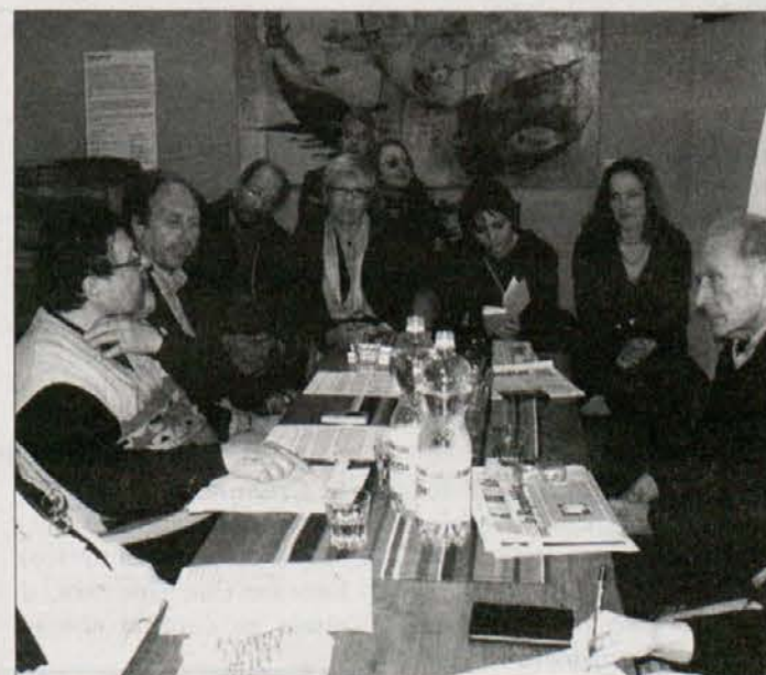
Alcuni dei protagonisti della serata di venerdì avvenuta nel locale dell'associazione Navel a Cividale

Ha concluso l'incontro la proiezione di un filmato sul lavoro degli operai della Fincantieri risalente agli anni Trenta.