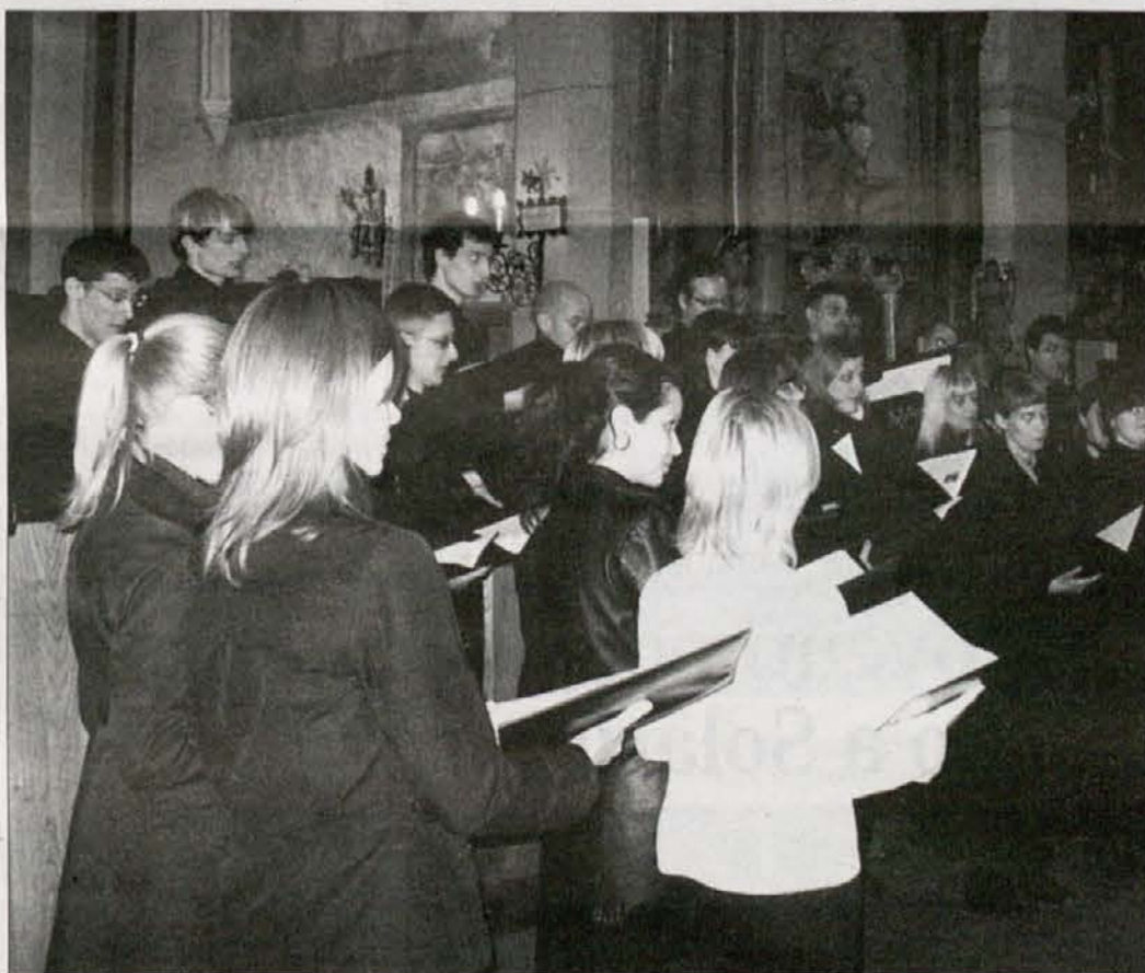
Komorni zbor Ljubljanskih Madrigalistov na Trbižu

Kakih devetdeset poslušalcev, kar je zadovoljivo za ta letni čas, se je v petek 5. aprila zvečer udeležilo celovečernega koncerta Komornega zbora Ljubljanskih Madrigalistov, ki je bil v župni cerkvi Sv. Petra in Pavla na Trbižu. Zbrani gostje so uživali ob ubranem in kakovostnem petju zbora, ki sodi v sam vrh gla-