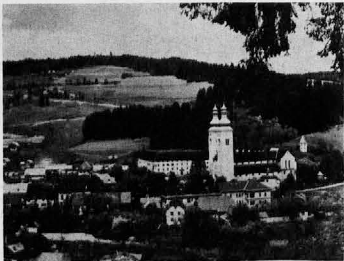
Romarska cerkev z nekdanjim samostanom v Krki na Koroskem, ki ju bo obiskal konec junija letos sv. oče

devala 4,5 milijona šilingov. Dunajsko nadškofijo bo papežev obisk stal 3 milijone šilingov. Za prireditve s papežem v Enns-Lorchu in Mauthausnu so prireditelji določili znesek 2,7 milijona šilingov. Za slavnostno bogoslužje v Krki v okviru romanja treh dežel je potreben znesek 4,15 milijona šilingov. Pet prireditev v Salzburgu dne 26. junija bo stalo 5 milijonov šilingov. Slavja s papežem v Innsbruchu (slavnostno bogoslužje in otroški praznik) bodo zahtevala 5,15 milijona šil.