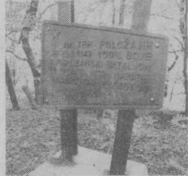
Obeležje na Pugledu

Ob cesti, ki pelje v Šentpavel, je tudi cesta v Brezje in Repče, vasi, ki spadata v KS Lipoglav. Cesta je zelo slaba in v zimskem času neprevozna, zato raje uporabljajo tisto, ki pelje skozi Panško