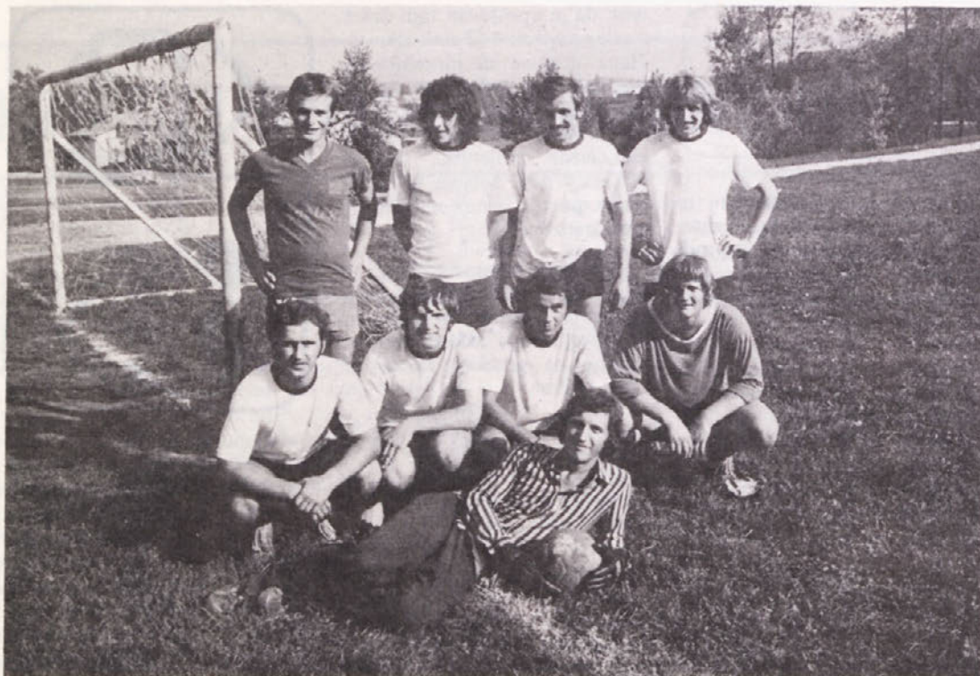
Naši nogometaši so nas tudi letos dostojno zastopali na DŠI; če pa ne bi pred zadnjim srečanjem prišlo do pomote, bi se lahko uvrstili še bolje . . .