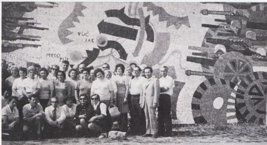
Udeleženci izleta so se slikali še pred veličastnim spomenikom

Naj bo za jesenske ali za pomladne dni, vedno vam bosta dobrodošla.