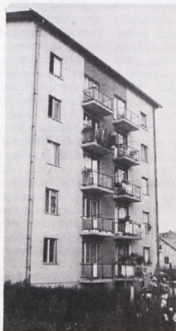
Novoteksov stanovanjski stolpič

sušilnotermofiksilnega stroja in nabavi širinskega pralnega stroja, bo na teh fazah ukinjeno delo ob sobotah popoldne in ponoči ter ob nedeljah. Ko pa se bo v izšivalnici zaposlilo dodatno število delavk, bo delo potekalo pet dni v dveh izmenah, ob sobotah pa samo dopoldne.