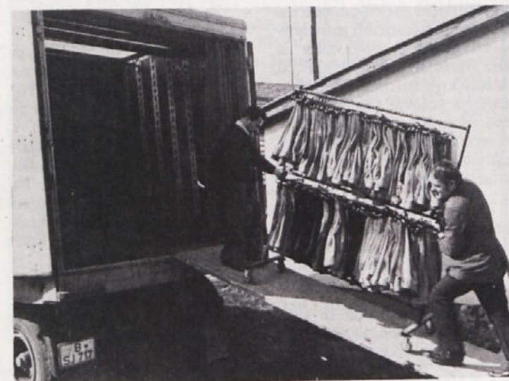
Nakladanje hlač za izvoz na kamion

je za 1 % slabše kot v istem obdobju lani in znaša v letošnjem prvem polletju 83,7 %. Nižja izkoriščenost kapacitet pa je posledica povečane proizvodnje nižjih številok preje.