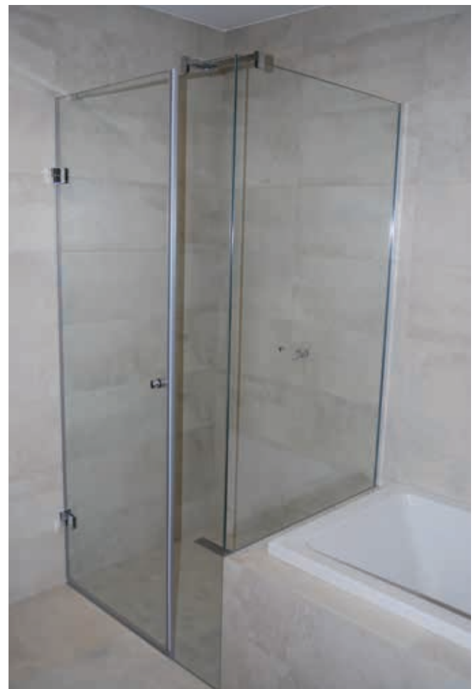
Začelo se je s tuš kabino

V logaški občini imamo dve industrijski coni, vendar ne v prvi ne v drugi ni mogoče kupiti tisoč m 2 zemlje za postavitev manjše delavnice in s tem pridobiti možnosti za širjenje in novo zaposlovanje, kajti trenutne smernice kažejo za vse večjo uporabo stekla v gradbeništvu. Za nakup večjega zemljišča pa taka, majhna delavnica finančno ni sposobna. Izven obrtne cone pa - po mnenju občanarjev - nobeno zemljišče ni primerno za mirno obrt.