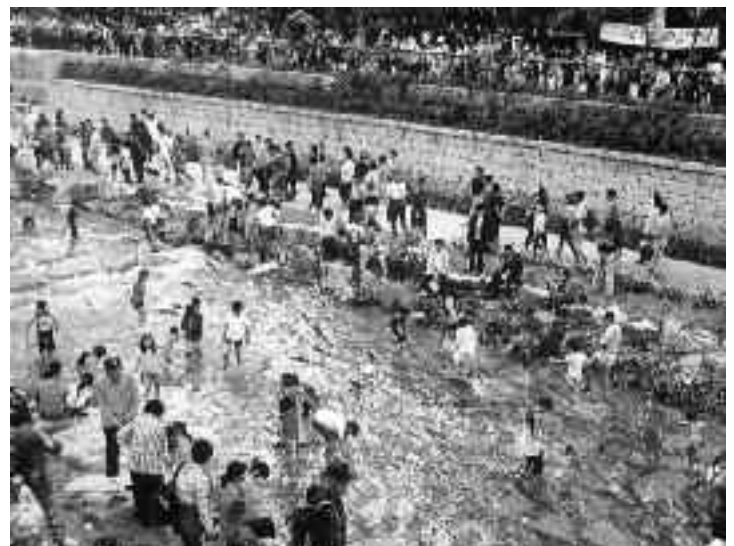
1 Novi potok Cheonggye v središču Seula

podrta in odstranjena avtocesta, ki je bila v preteklosti zgrajena nad potokom. Na ta način so lahko ponovno odprli in na novo uredili korito in obrežje nekdanjega potoka, oblikovali nove sprehajalne poti in javne površine in potok povezali z mestom. V veliki meri so obnovili tudi bogato zgodovinsko dediščino, na katero so naleteli med prenovo, in jo vključili v podobo novega potoka. Kljub zapletenosti prenove, ki je potekala v enem najgosteje naseljenih in najbolj prometnih delov mesta, je bil po samo dveh letih in treh mesecih Cheonggyecheon leta 2005 znova odprt (Slika 1). Čeprav je novi potok Cheonggye v trenutku postal ena izmed osrednjih znamenitosti v Seulu, je sočasno zlasti na lokalni ravni povzročil tudi nekatere izrazito negativne družbene, gospodarske in prostorske učinke. Zaradi prevladovanja političnih in gospodarskih interesov metropolitanske vlade, ki je prenovo potoka razumela kot "razvojni koncept skrit pod krinko okoljevarstva," 10 kar se je med drugim odrazilo prav v neverjetni naglici preobrazbe, so se na območju Cheonggye močno povečale vrednosti nepremičnin in življenjskih stroškov, prišlo je do izseljevanja lokalnih prebivalcev in izgube delovnih mest v lokalnem gospodarstvu in trgovini. Prenova potoka Cheonggye je posredno vplivala tudi na izginjanje javnih prostorov, na katere je bila tradicionalno vezana lokalna proizvodnja in potrošnja in so predstavljali osrednje kraje srečevanja prebivalcev in reprodukcije lokalne kulture. 11