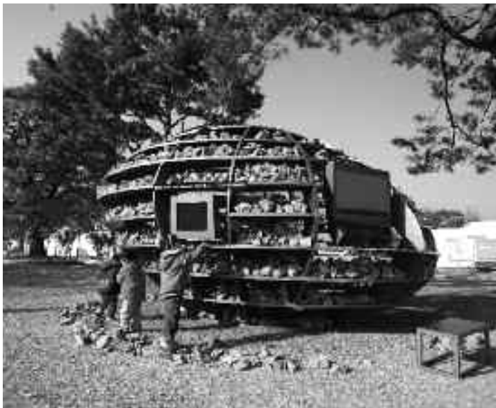
4 Kamen spominov z gore Inwang (Cho Im-Sik, Choi Yeon-Sook in Shin Seung-Soo)