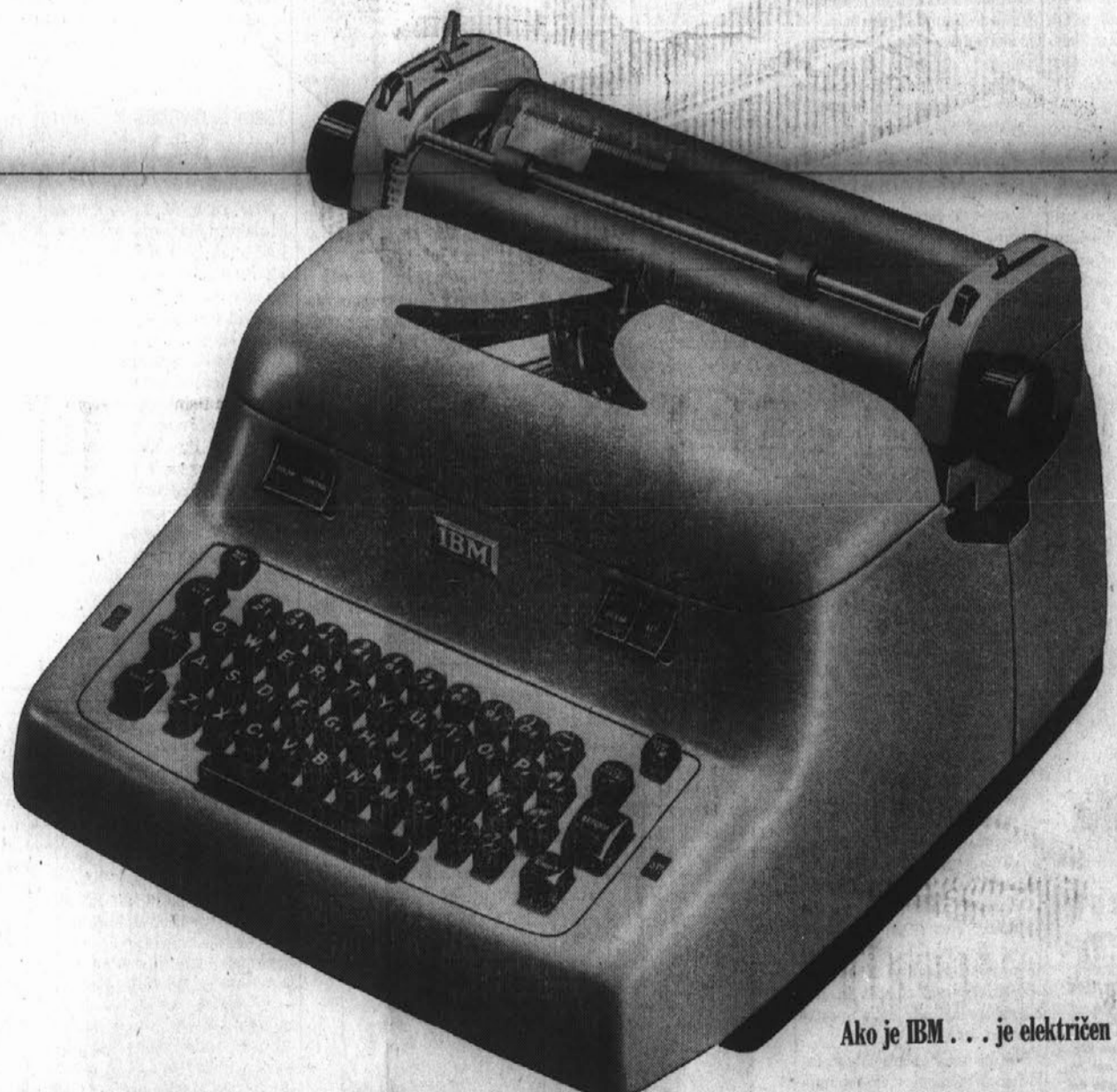
Ako je IBM . . . je električen

Na ogled v Clevelandu v uradu 2045 Euclid Avenue