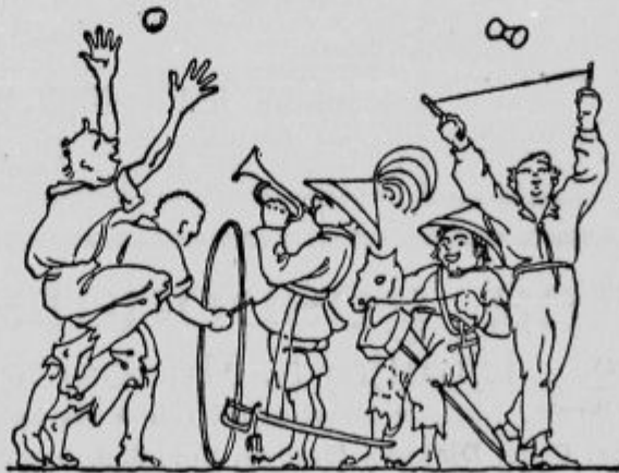
»Igrajo se in zabavajo od jutra do večera.«

»O kako lepa... kako lepa... kako lepa dežela!...«