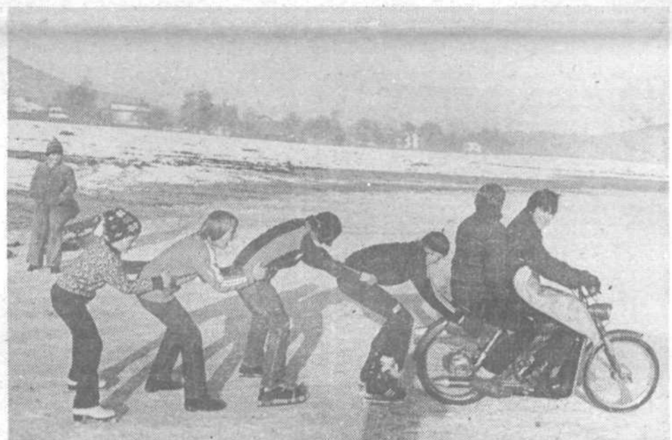
Snega praktično ni, mrzle noči pa vendarle poskrbijo, da voda v bajerjih in ribnikih zamrzne in z drsalkami na nogah je tudi dan krajši!

Šolska športna društva - na Brezovici so pripravili smučarski tečaj v drugem tednu, na Dobrovi imajo pripravljene enotedenske aktivnosti na snegu in tečaj smučanja, en teden šole v naravi so pripravili v Horjulu, v drugem tednu počitnic SŠD IG organizira smučarski tečaj in aktivnosti na snegu na Golem, tudi v Polhovem Gradcu pripravljajo enotedenski smučarski tečaj, skupaj s planinskimi društvom so v Presejru načrtovali za vse tri tedne smučarski tečaj (v primeru brez snega - 3 izlete), ob velikolaški šoli bo potekal smučarski tečaj dva tedna, SŠD Vrhovci in Oskar Kovačič pa načrtujeta tečaje in tekmovanje skupaj s SK Krim oz. Brdo.