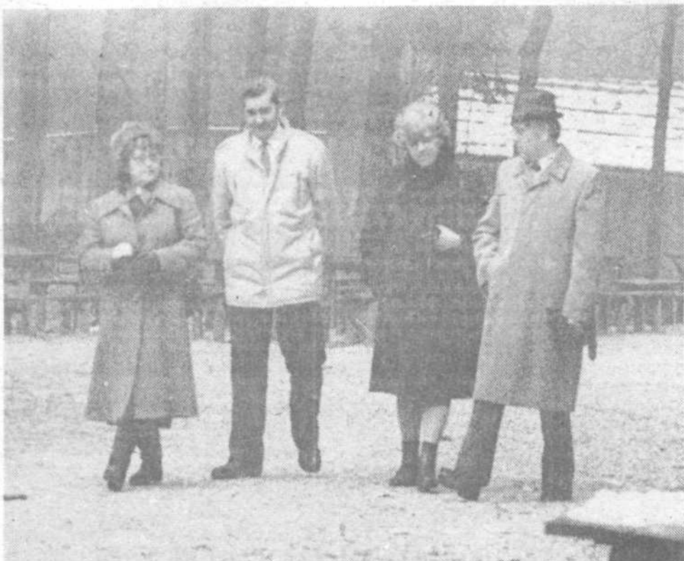
Sončen prvi mesec v letošnjem letu je sila neprizanesljiv s snežnimi padavinami. Izlet in sprehodi v bližnjo naravo pa so nam kar dobrodošli.

Ob boleči izgubi tovariša Vladimira Bakarića, predvojnega komunista in doslednega borca za graditev socialistične samoupravne federativne Jugoslavije, misleca in teoretika, katerega lik in delo bosta trajno začrtana v naših vrstah, vam v imenu občinske organizacije zveze komunistov občine Ljubljana Vič-Rudnik izrekamo naše iskreno sožalje. Ljubljana, 17. januarja 1983