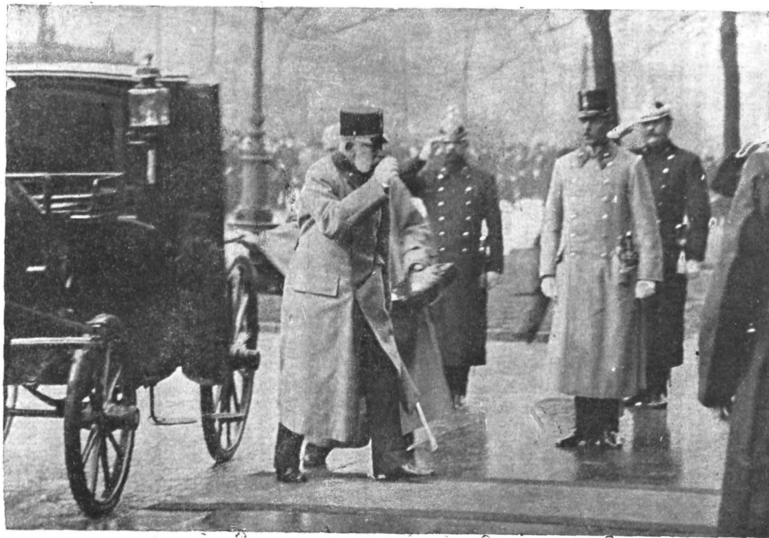
Cesar gre obiskat ranjence