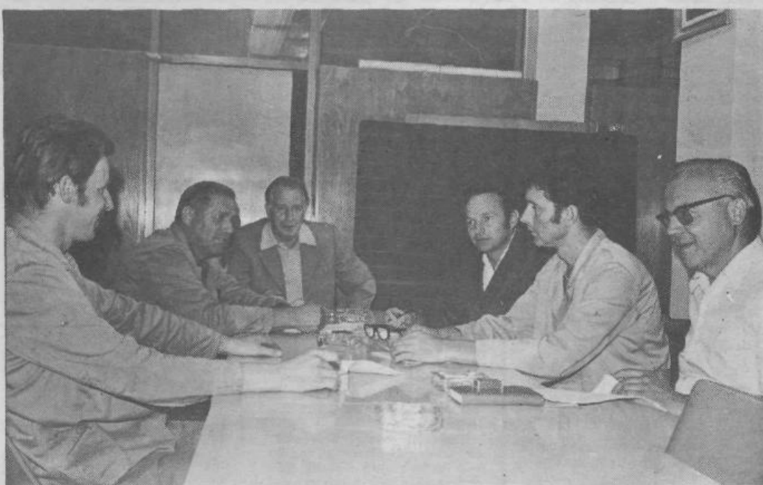
Delegati Toplarn, KEL in Elluxa

„Gradivo, ki ga moramo preštudirati dobimo pravočasno, vendar bi moralo biti veliko krajše oziroma bolj zgoščeno.“ V isti sapi pa so pripomnili: