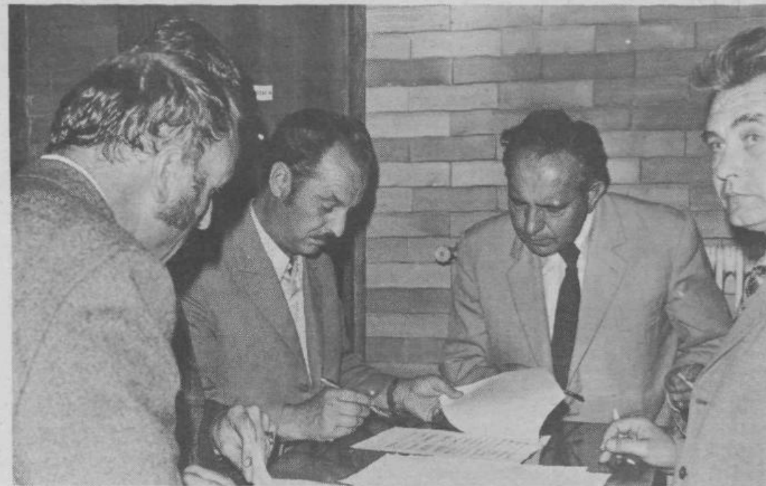
Živahna debata se odvija tudi v skupščinskih kuloarjih