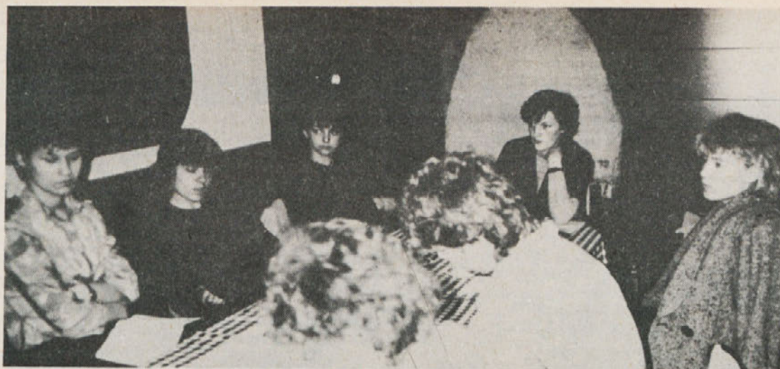
Sestali so se predsedniki, ali bolje rečeno, predsednice osnovnih organizacij mladine in med mnogimi sklepi sprejele tudi odločitev, da kviz bo.

Pred kratkim smo se na skupnem sestanku v Novem mestu zbrale predsednice vseh osnovnih organizacij ZSMS v Labodu, manjkala je le predsednica iz Temenice. Da, prav ste prebrali, mladinske organizacije v tozdih vodimo dekleta. Povsem logično in pravilno, saj smo pretežno ženski kolektiv.