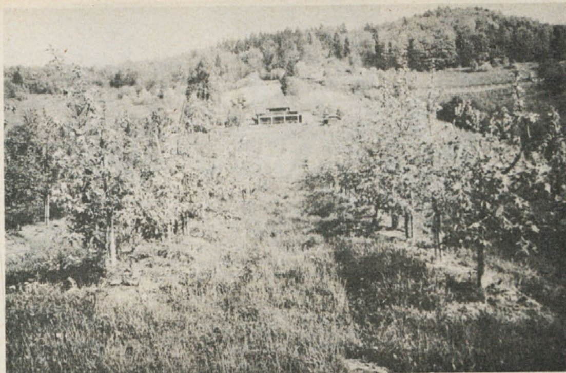
Težko je reči v katerem letnem času so Sromlje najlepše...