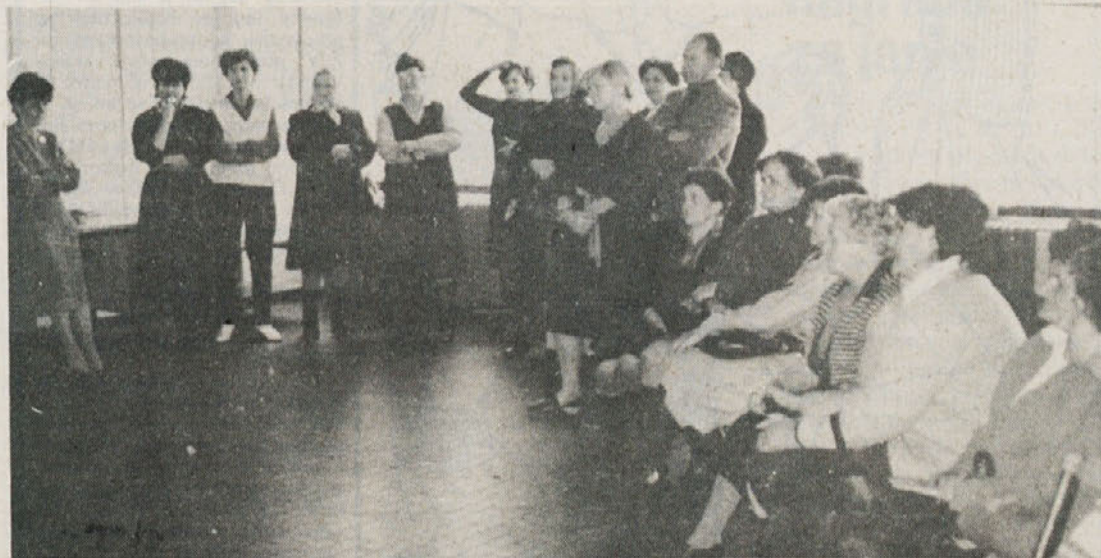
Srečanje naših upokojevcem v Libni.