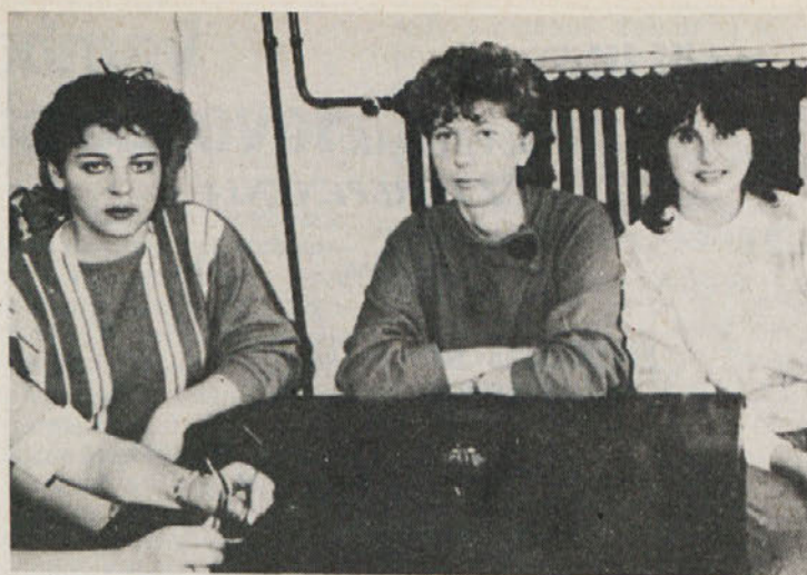
Samo da je mimo... Po pripravniških izpitih v Delti.