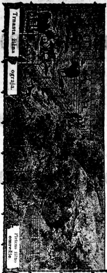
Tmasta žilna ograja.

Prva električna ljubljanska in tovarna mrežastih ograj