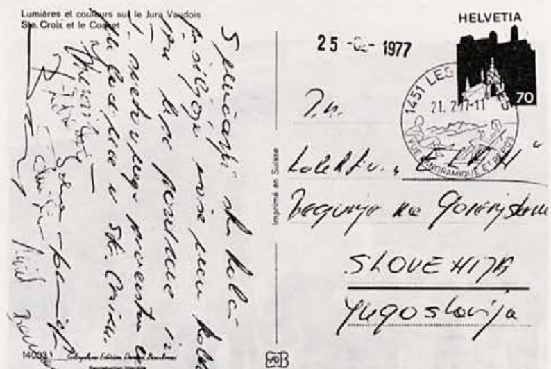
Pozdrav iz svetovnega prvenstva mladincev — skakalcev