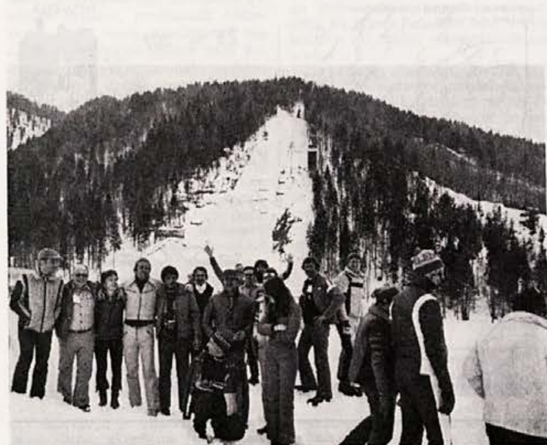
Kanadčani in Američani so seveda obiskali svetovno znano Planico, ki je sredi priprav za letošnje polete