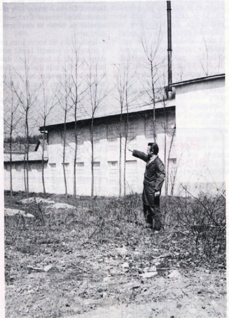
Črnomaljski obrat se na gradnjo šele pripravlja. Obratovodja Šiler kaže zemljišče za tovarno, ki je že odkupljeno in kjer se bo gradnja že letos začela

Vtis: strašen ropot, veliki stroji, malo delavcev. V pletilnici smo z zanimanjem ogledovali okrogle stroje, na katerih delajo pletivo, iz katerega potem pri nas izdelujemo spodnje žensko perilo. Vse nam je bilo zanimivo, tudi v barvarni, v krojilnici in drugje. Vse je bilo čisto in pospravljeno. Videli smo tudi delo v novem mehanografskem centru. Po obilnem kosilu smo se zadovoljni vrnili v Mirno peč, vsem, ki so nam omogočili to ekskurzijo, pa se lepo zahvaljujemo. VERA MATKOVIČ