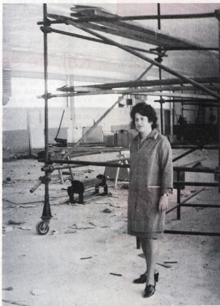
V Dobovi gradnja ne napreduje tako naglo kot bi želeli. Težav je veliko, pa vendar zidovi stojijo in notranja dela so v teku