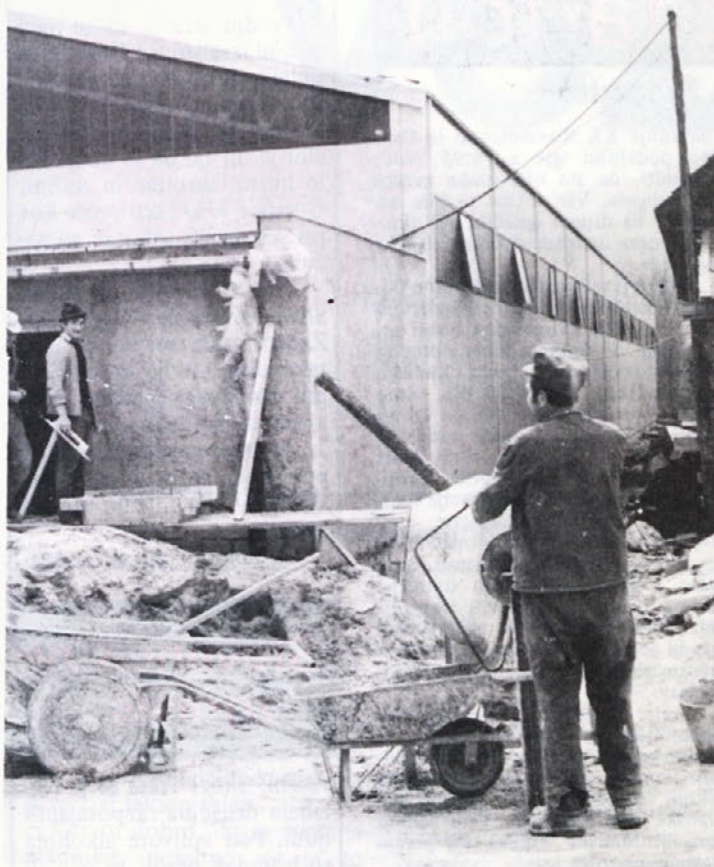
Rekonstrukcija v Mirni peči čez zimo tudi ni napredovala po načrtu, vendar do otvoritve ni daleč. Morda že za 1. maj