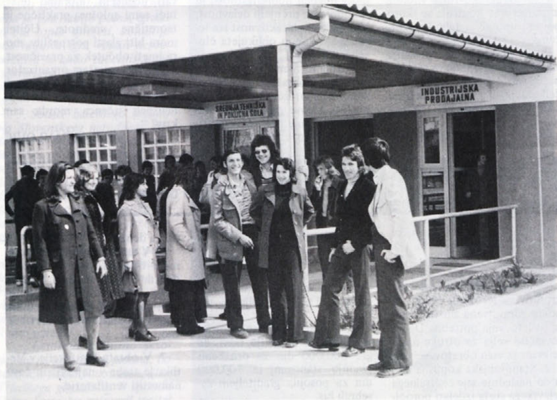
Obiskov v metliškem obratu BETI ne manjka, spomladi pa jih je še več kot običajno, ko se začenjajo šolske ekurzije. Pred dnevi so bili na obisku tudi dijaki srednje tekstilne šole iz Kranja (na sliki)

Odgovore zbrali: JOŽICA TEPPEY in RIA BAČER