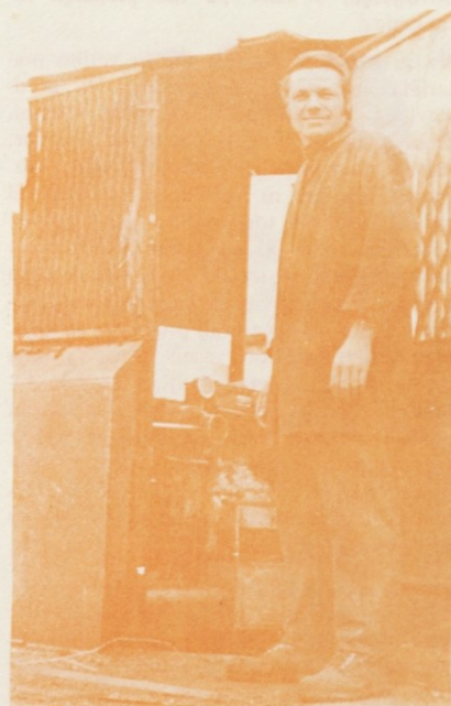
Strojnik na ploščadi Arnoldovke