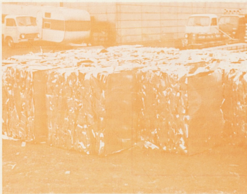
Paketi oziroma bale alu-odrezkov v IMV

paketira papir, pretežno valovito lepenko in alu-odrezke. Paketira sam, tu pa dela že 10 mesecev. Spaketira vse sproti. Paketi so težki od 200 do 300 kg, ne glede na to, ali je v njih papir ali aluminij.