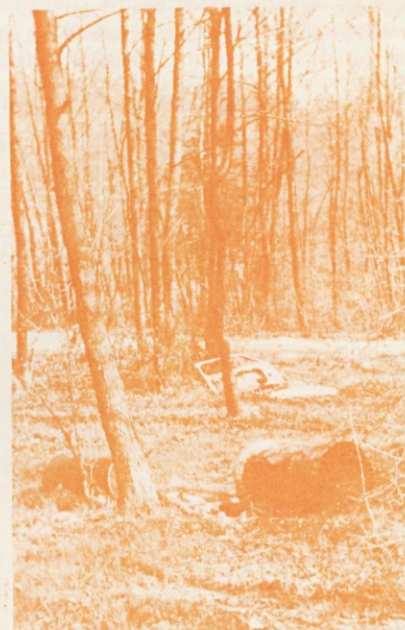
V dolini potoka Črnušnice pod Rašico pri Ljubljani