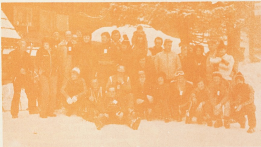
Smučarji in smučarke Surovine in Dinosa na Krvavcu dne 14. marca 1978