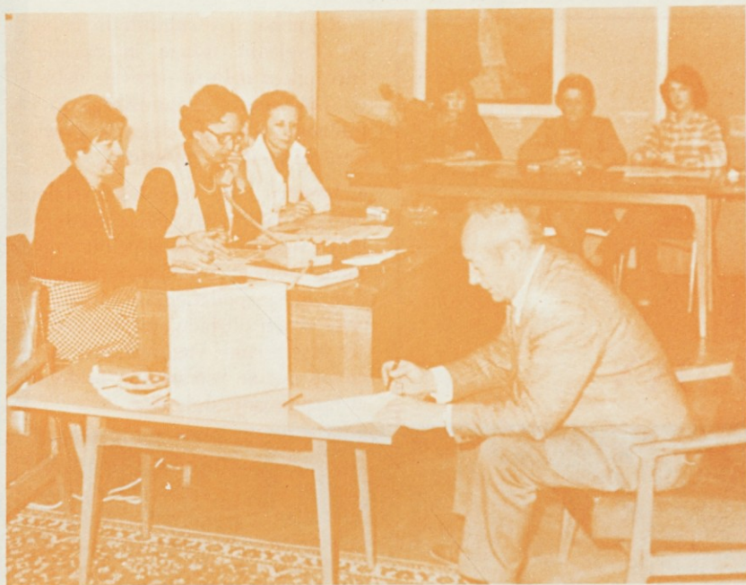
DINOS LJUBLJANA. Volitve 9. marca 1978