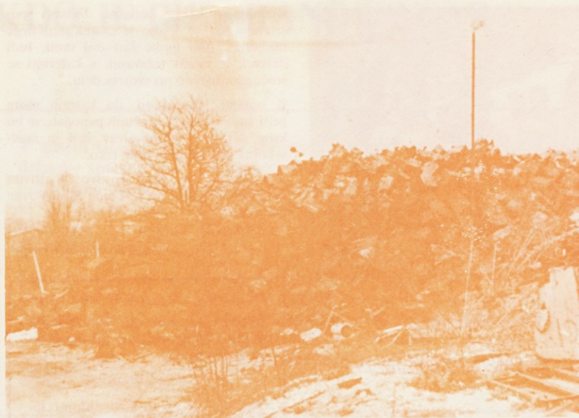
Zaloga paketov, narejenih s paketirno Arnold, dve 11. aprila 1978