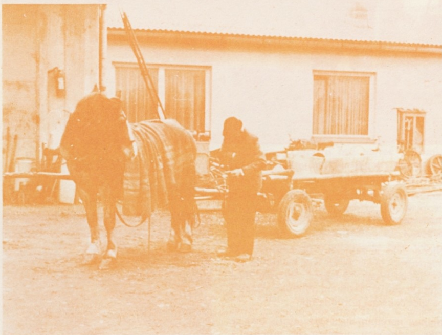
„Koliko sva dobila...?“