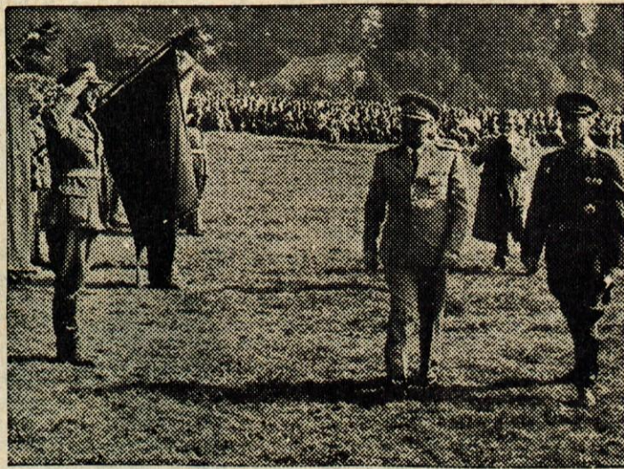
Maršal Tito je ob prihodu na slavnostni prostor sprejel raport komandantov in obšel postrojene štajerske brigade.

Razen glavne proslave v počastitev 35-letnice ustanovitve SKOJ, ki bo za radovljiški okraj v dnevi od 3. do 10. oktobra, bodo v tem tednu tudi lokalne proslave po skoraj vseh krajih okraja. Tako bo proslava tudi na Jesenicah, na katero se je jeseniška mladina že pričela pripravljati. Na tej proslavi bo zapel mladinski zbor Vajenske šole, ki obeta v letošnjem šolskem letu lepe uspehe.