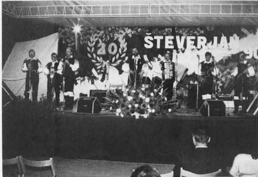
Z lanskega festivala zabavne glasbe v Števerjanu