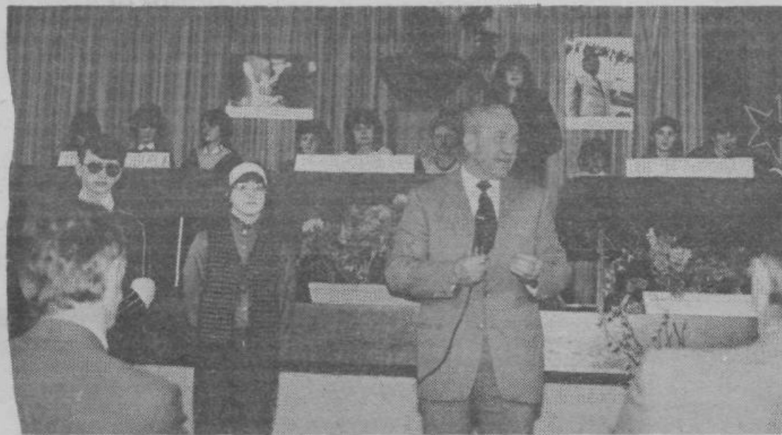
Generalkolovnik Jože Ožbolt med pogovorom z učenci na občinskem kvizu »Tito—Revolucija—mir« v Šentvidu pri Stični

Na podlagi 55. člena Zakona o stanovanjskem gospodarstvu (Ur. l. SRS, št. 3/81) 28. in 20. člena Samoupravnega sporazuma o temeljih plana Samoupravne stanovanjske skupnosti občine Grosuplje za obdobje 1981—1985 in 23. člena enotne metodologije za določanje in evidentiranje stanarin v SRS (Ur. l. SRS, št. 25/81) je skupščina Samoupravne stanovanjske skupnosti občine Grosuplje na seji dne 14. 4. 1983 sprejela