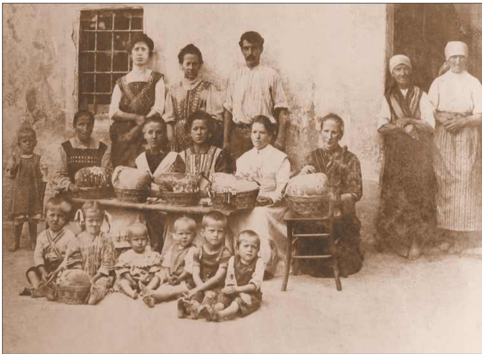
Čipkarice iz Železnikov leta 1910.

okolju prodaja čipk še bila organizirana, so klekljarice hodile prodajat svoje izdelke v Idrijo. Kasneje tega niso več počele, saj so se našli posredniki za prodajo čipk. Tako so sedaj oni skrbeli za zaslužek čipkaric.