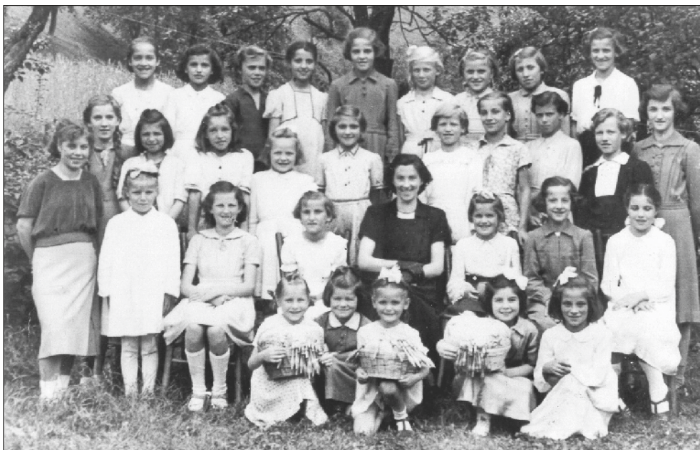
Generacija Čipkarske šole v Železnikih leta 1953.