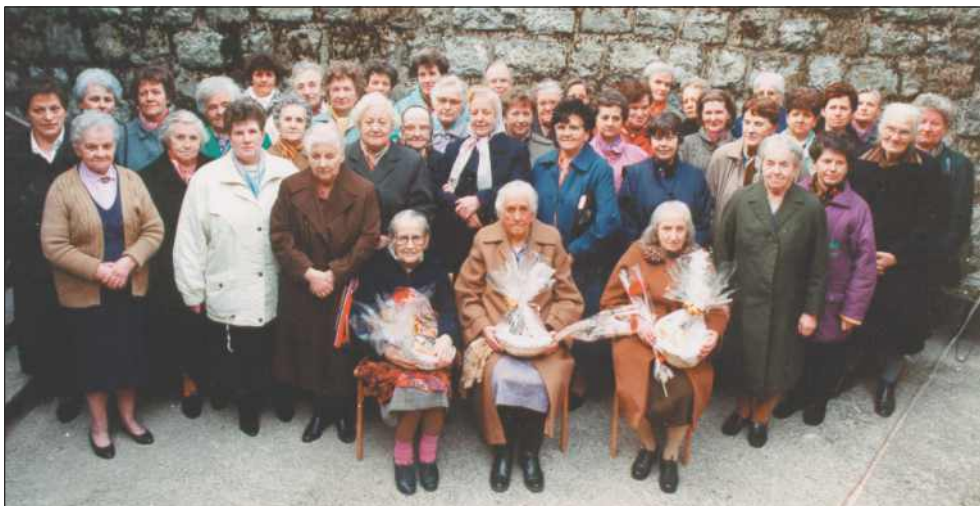
Klekljarice iz Železnikov leta 1997.