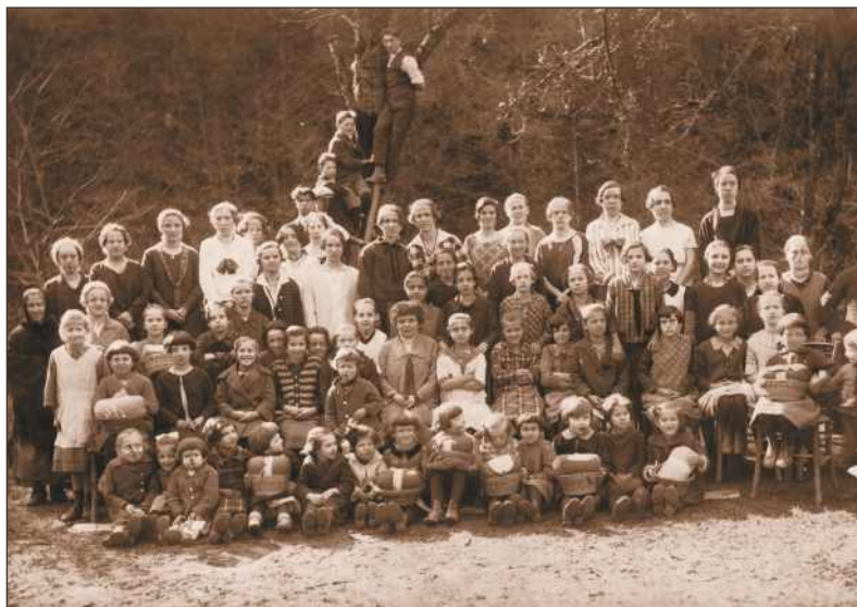
Učenke Čipkarske šole, okrog leta 1930.

Leta 1926 je Državni osrednji zavod za žensko domačo obrt organiziral tečaj v Selcih, ki ga je