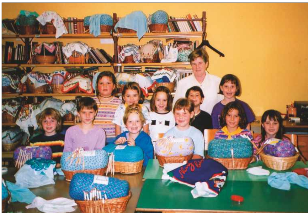
Učenke čipkarske šole v OŠ Železniki leta 2002.

Čipkarska šola je potekala enkrat tedensko, v štirih skupinah v katerih je bilo od 15–20 učenec. Pouk je potekal po posebnem učnem načrtu oz. programu idrijske čipkarske šole, obsegal pa je osem letnikov. Ker so šolo obiskovali učenci z