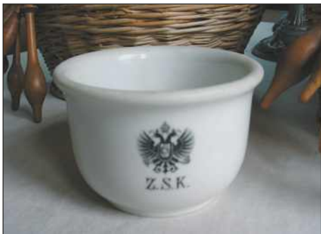
Skodelica za mleko z avstrijskim grbom in napisom: Zentral Spitzen Kurss. Hrani Muzej Železniki.