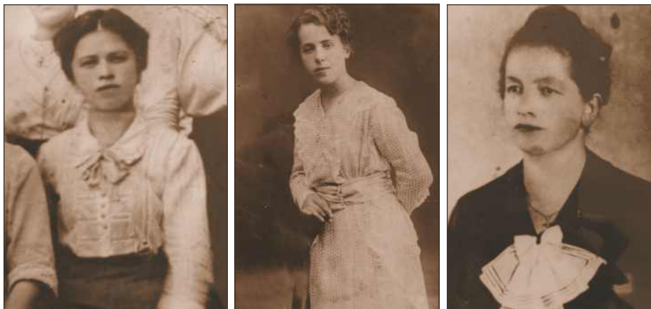
Zadružni odbor prve Čipkarske zadruge leta 1920.

Članice Čipkarske zadruge so dobile knjižice z organizacijskimi pravili, poleg tega pa so zanje organizirali tudi nekaj predavanj, ki so govorila o tem, kakšne so njihove dolžnosti in koristi. V zadrugo so bile včlanjene tudi klekljarice iz Selc. V