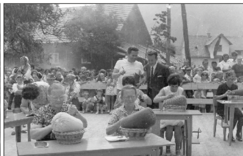
Na Čipkarskem dnevju leta 1973.