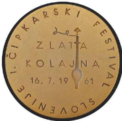
Zlata medalja I. Čipkarskega festivala Slovenije, 16. 7. 1961, ki jo je kot najboljša prejela Čipkarska zadruga iz Železnikov.