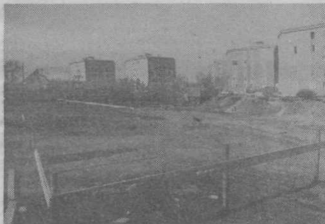
Splošno gradbeno podjetje Grosuplje je konec preteklega leta pričelo s pripravami za gradnjo nove samopostrežne trgovine v Polju. Zdaj sicer šele kopljejo