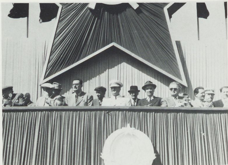
S proslave 1. maja 1949 (Dokumentacija Dela)

Sir Charles Peake z ženo na sprejemu pri Titu. Na desni Leo Mates, jugoslovanski diplomat (Dokumentacija Dela)