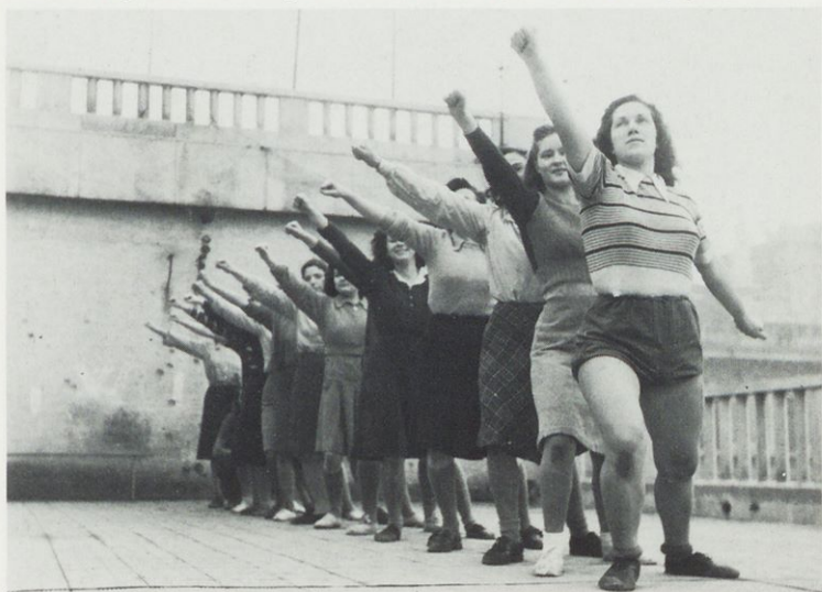
Priprava na 1. maj 1948. leta v Trstu