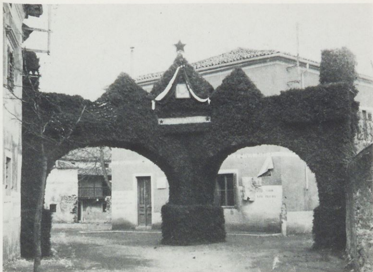
Tako so spomladi 1946 prebivalci Primorske manifestirali željo za priklučitev k Jugoslaviji