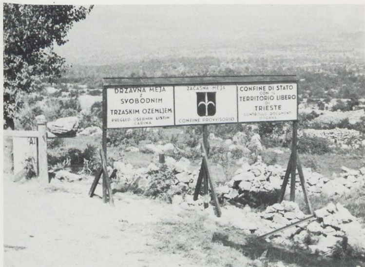
Meja s STO, postavljena septembra 1947