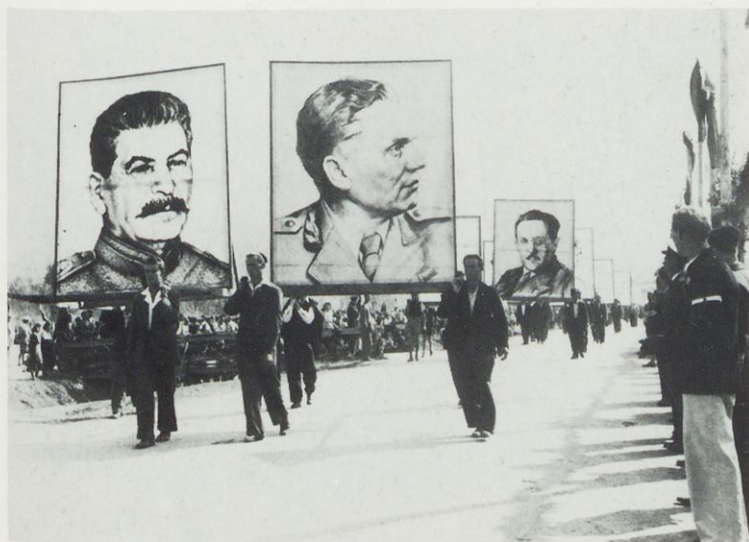
Proslava ob priključitvi Istre k Jugoslaviji 21. 9. 1947