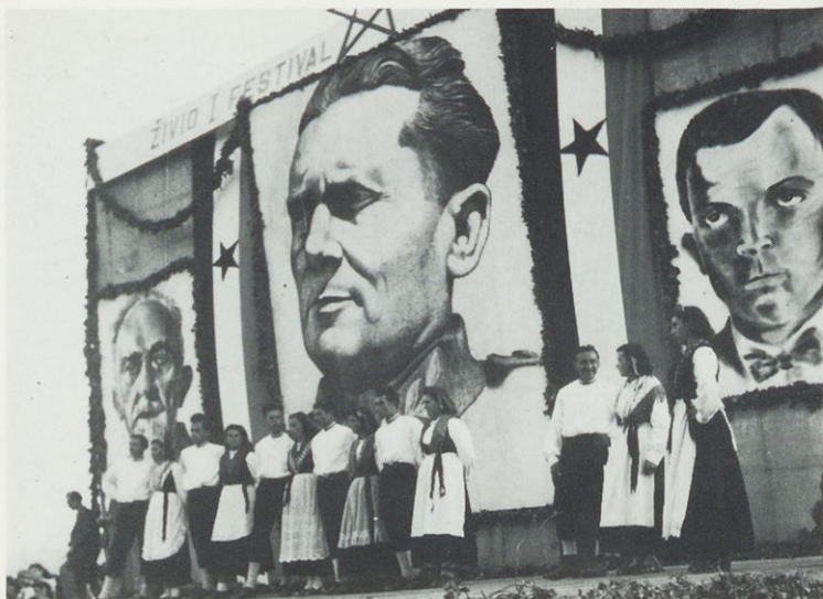
Festival hrvaške kulture v Bujah, oktober 1947