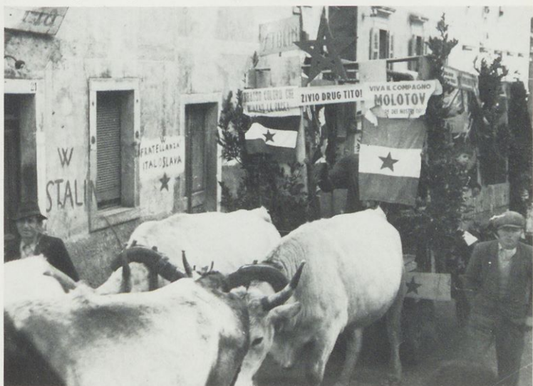
Ob zaključku agrarne reforme, Buje, marec 1947