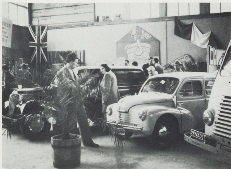
Zagrebski velesejem maja 1948