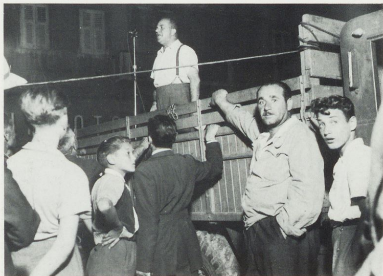
Vittorio Vidali govori tržaškim delavcem julija 1947