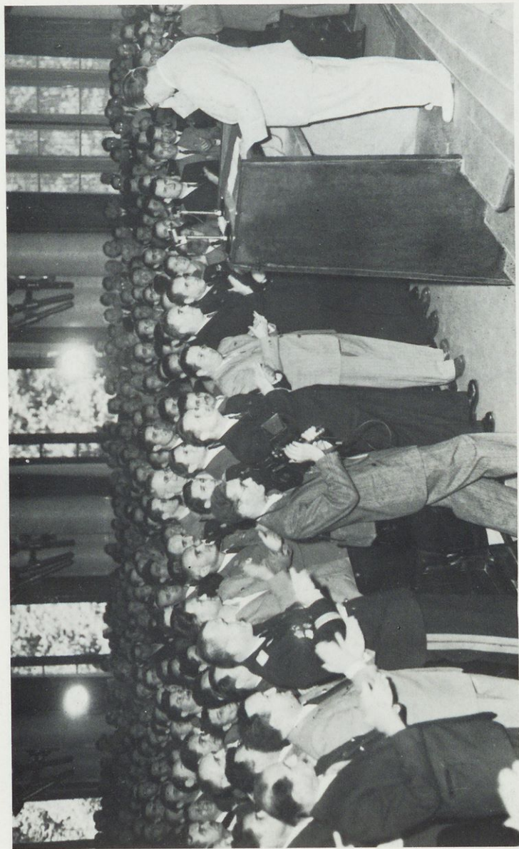
V. kongres KPJ, julij 1948 (Dokumentacija Dela)