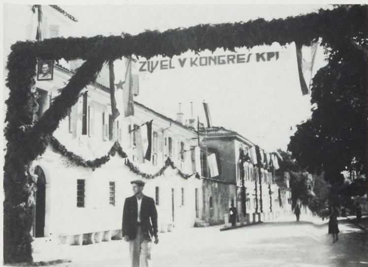
Okrasitev Sežane ob V. kongresu KPJ, julij 1948