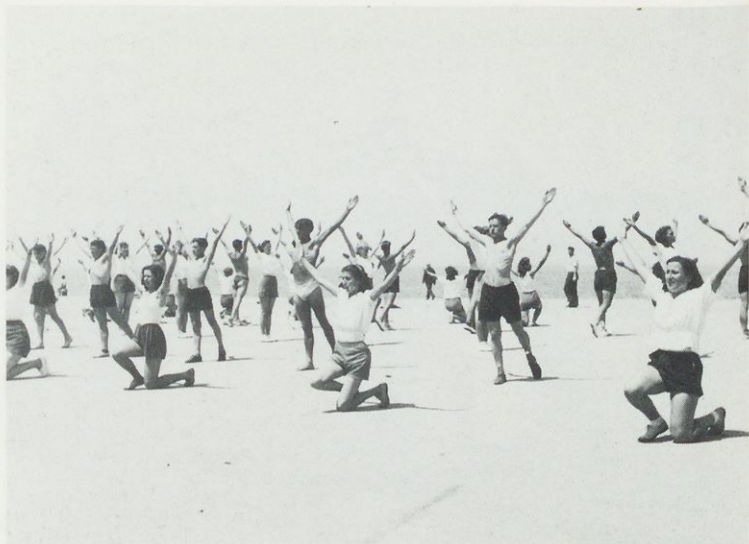
Priprave telovadcev za nastop v Beogradu, maj 1947