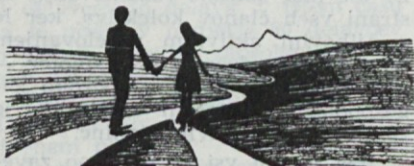
Paštebar Cveta in Merkužič Stane