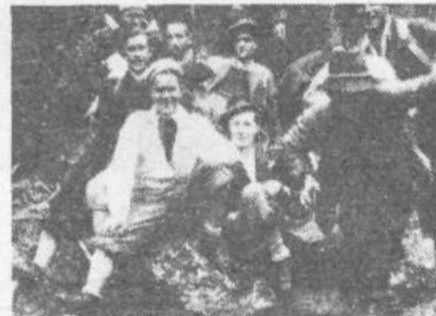
Skupina prvih partizanov na Krimu

kem osvobojenem ozemlju v okolici Iga in prvih volitvah v narodno osvobodilne odbore. Ko pa se leto prevesi v poletje, nastopi velika italijanska ofenziva; terjala je veliko žrtvev in še požrtvovalnejšega političnega dela.