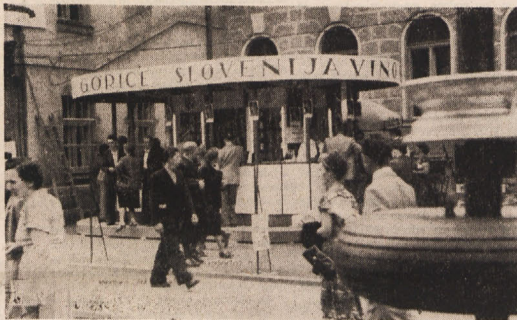
V prodajnem paviljonu tvrdk „SLOVENIJA VINO“, Ljubljana, in „SLOVENSKE GORICE“, Ptuj, obiskovalci velesejma radi poskušajo izvrstna jugoslovanska vina. Prav tako ima mnogo obiskovalcev paviljon tvrčke „VINO KOPER“, ki stoji na drugem mestu.

Osem dni koroškega velesejma je že poteklo, v naglici bodo minili še ostali velesejski dnevi. Izkoristite torej še zadnje dni in ne zamudite obiskati velesejma preden se bodo zaprla vrata. Vsakdo najde tam za svojo stroko in za svoje posebne interese vzpodbudne in zanimive novosti.