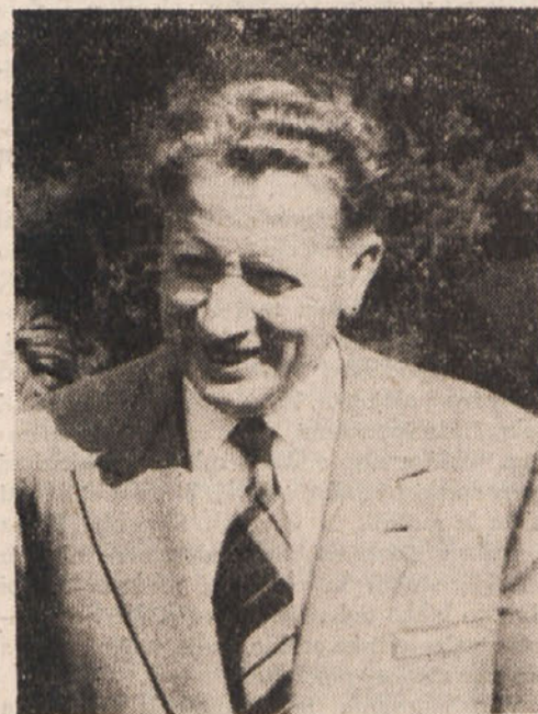
Predsednik Izvršnega sveta LR Slovenije Miha Marinko