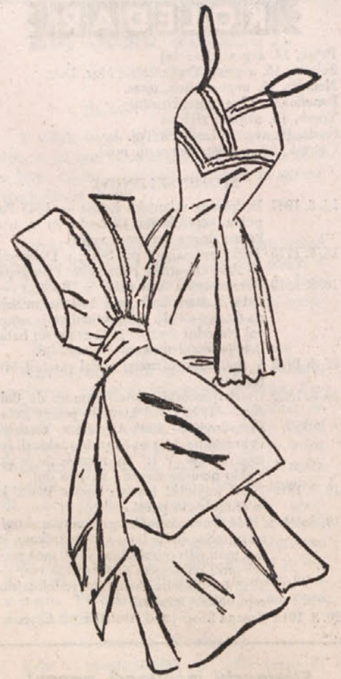
Spodnje krilo in nočna srajca iz svile

Razen tega pa imajo rejci ovac še eno prednost. Znatno del dohodkov dobijo namreč od mesa teh živali. Ovce s svojimi proizvodi so velika gospodarska sila, v katero je investiran mnogokrat večji kapital kot v industriji umetnih vlaken. Na zemlji je nad 760 milijonov ovac, tovarne po vsem svetu pa potrebujejo skoraj milijardo kilogramov volne na leto.