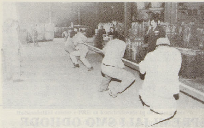
Vlečenje vrvi v Jeklarni