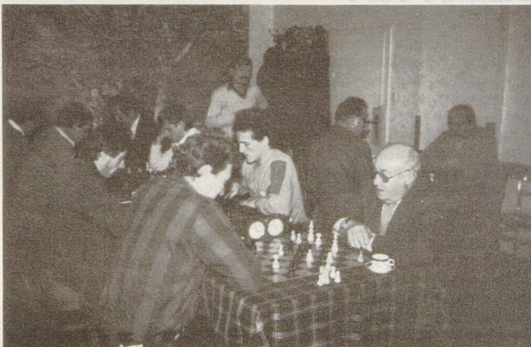
Tudi šah je razvedrilo mnogim delavcem Jeklarne