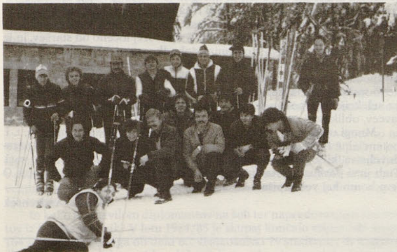
Jeklarji na smučarskem tekmovanju