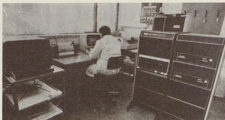
Računalniški center v PRE za konstruiranje in delovne stroje

Prehodnost študentov iz 1. v 2. letnik je 60 % (vpisali so se tudi študenti iz predhodnih letnikov), v 2. letnik VŠ je prehodnost 50 %. Z analizo