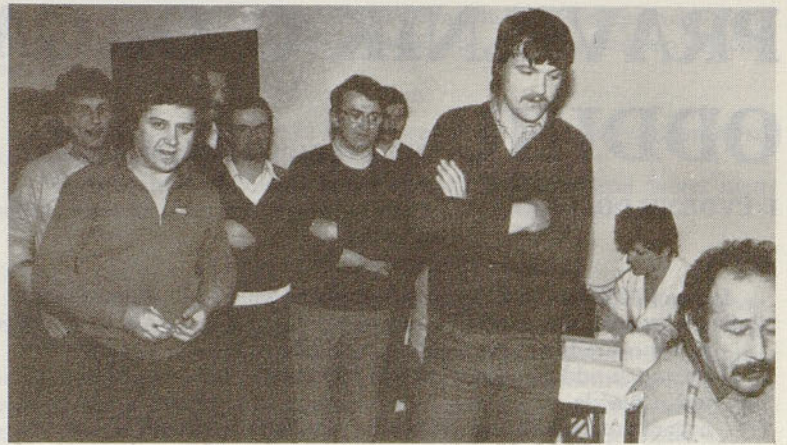
Udeleženci krvodajalske akcije