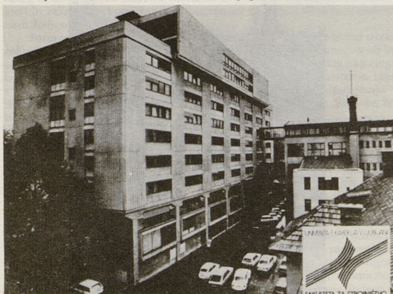
Fakulteta za strojništvo v Ljubljani