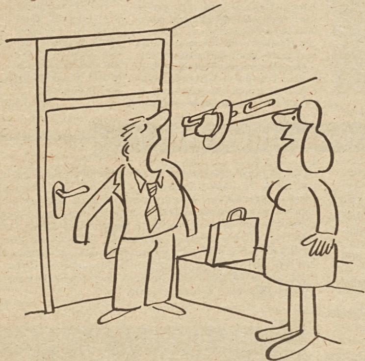
– Danes sem pa zelo utrujen, v službi na sestanku nisem niti očesa zatisnil.

Tisk ne more biti samo regulator dogodkov v družbi, opozovalec, ki „objektivistično“ prikazuje dogodke in pojave, marveč je tudi aktiven udeleženec in bорец za socialistično samoupravno usmeritev. To ne zmanjšuje njegove obveznosti, da objavlja objektivno in popolno informacijo, pač pa terja tudi aktivno vplivanje na odnos do dogodkov, njihovo pojasnjevanje in boj s perestrojko za vsakdanje sprejemanje in širjenje socialističnih pozicij v družbi. Tak odnos tiska do njegovih obveznosti vključuje tudi njegovo pravico, da ima dostop do vseh pomembnejših informacij in pa njegovo odgovornost za to, kako informacije uporabi.