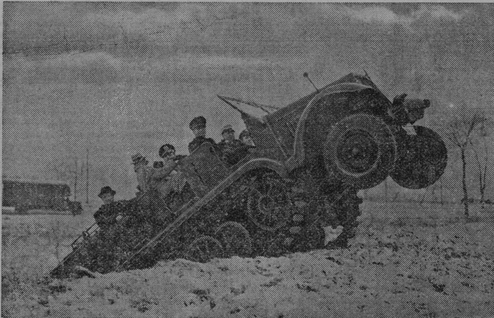
Nemška in italijanska komisija preizkušata nove iznajdbe glede vožnje tankov preko ovir