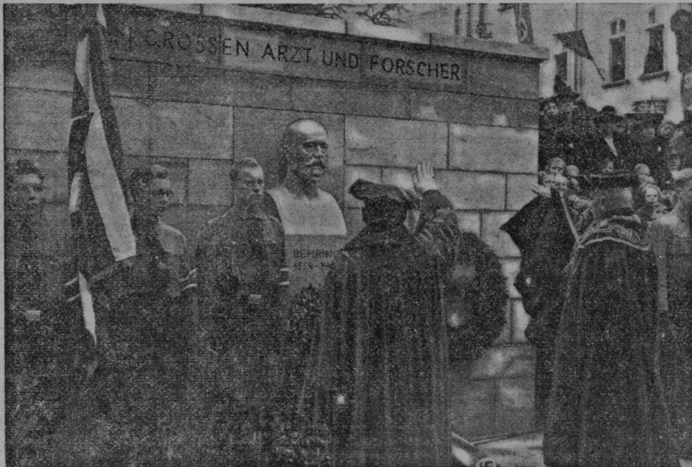
Ob 50 letnici smrti so odkrili v Marburgu v Nemčiji spomenik Emilu Behringu, odkritelju zdravila (seruma) zoper davico

Avstralijo in vsa obširna morja. Zato ni pretirano, če rečemo, da bi tedaj vsi Amerikanci živeli pod žrelom topa, ki bi bil napolnjen tako z vojaškimi, kakor tudi z gospodarskimi eksplozivnimi naboji. Ne zapirajmo si oči pred nedvoumnim dejstvom, da se nahaja nevarnost že pred našimi vrati. Zedinjene države ne bodo odnehale od sklepa, da podpirajo Veliko Britanijo (Anglijo). Noben diktator niti nobena diktatorska sestava ne bo z nikakršnimi grožnjami omajala te naše očiščene. Jaz verujem, je rekel Roosevelt, da državi osi te vojne ne bosta dobili. To svoje prepričanje opiram na najnovejši in najboljši poročila. Treba pa je Angliji hitra noč. Evropski narodi, ki se bore, da bi se ohranili, ne zahtevajo od nas, da bi se zanje borili. Ni nobenih prošenj, da bi se poslal kak ameriški vojaški ekspedicijski zbor v Evropo. Prav tako ne obstoji pri nobenem članu ameriške vlade namera, da bi se kak vojaški ekspedicijski zbor res tudi poslal. Evropski narodi prosijo za hrano in za sredstva za vojno, za strelivo, za letala, tanke, topove in ladje. Vse, kar je potrebno, moramo poslati v zadostnih količinah in hitro. Roosevelt je naslovil nujen poziv na lastnike industrijskih podjetij, na ravnatelje tovarn in na delavce, naj storijo vse, kar morejo in kar je njihova dolžnost, da se bo brez zamude čim hitreje izdelalo potrebno orožje in strelivo.