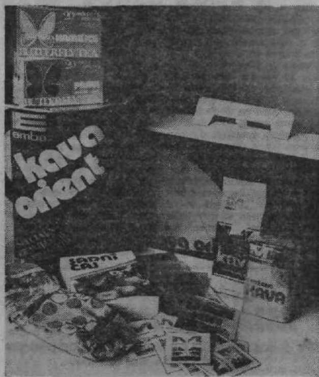
Glavni proizvod EMBE, enovite delovne organizacije v sozdu Mercator, je nedvomno kava. Postopek prženja in mletja kave so razvili na izredno visoko raven, dosegli zavidljivo stopnjo avtomatizacije, pa tudi kvalitete, saj so z njihovimi kavami vsi zadovoljni. Skrivnost je v prženju in mešanju, pravijo in dodajajo, da njihova kava ne prihaja v stik s človeškimi rokami, pa tudi hladijo je po mletju ne na odprtem, tako da ostaja popolnoma čista in ne izgubi prijetne arome. Na sliki je nekaj proizvodov Embe.

Majhnosti so se v Agens projektu torej izognili — s povezavo v sozd pa so naredili tudi pomemben korak pri uredniševanju zakona v združenem delu.