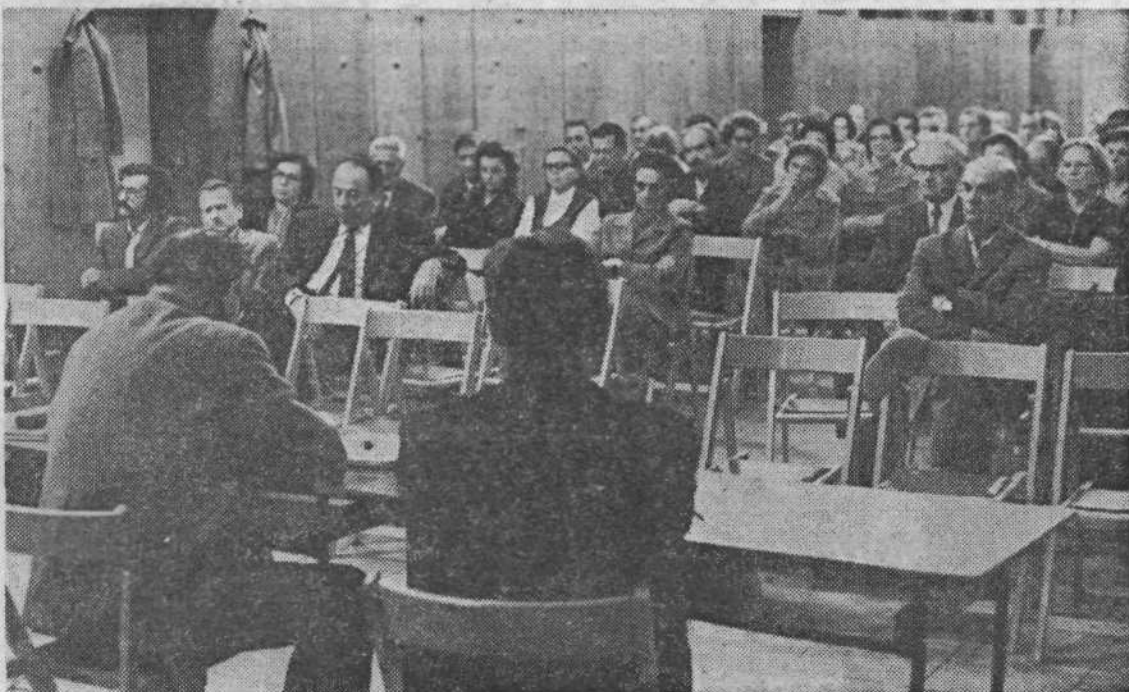
GRADIŠČE: Največ o krajevni skupnosti