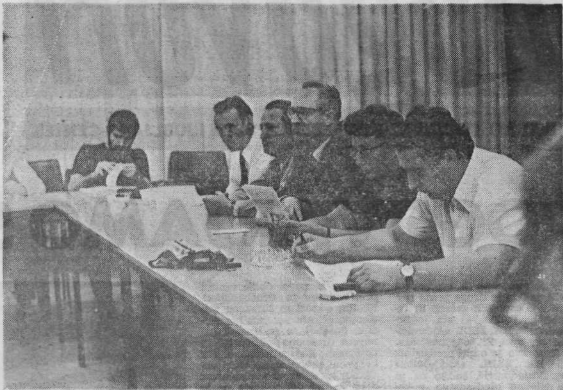
VODMAT: Razprava o osnutku zakona o stanovanjskih razmerjih